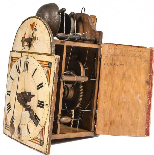
Entlebucher Surrer. Entlebuch, um 1780. Kurzes Vorderpendel, Entlebucher-Hemmung, grosser Windfang, 4-Viertel- und Stunden- schlag auf 2 Glocken. Inv. 381.

Merkmale der Berner Uhren sind die kubische Form der Gehäuse mit Zifferblatt und Aufsatz. Die Form erinnert an die Comtoise-Uhr, ein Einfluss dieser Uhren aus der Franche-Comté ist möglich. Die Uhrengehäuse samt Zifferblatt sind bei Berner Uhren oft aus Buchenholz. Der ►