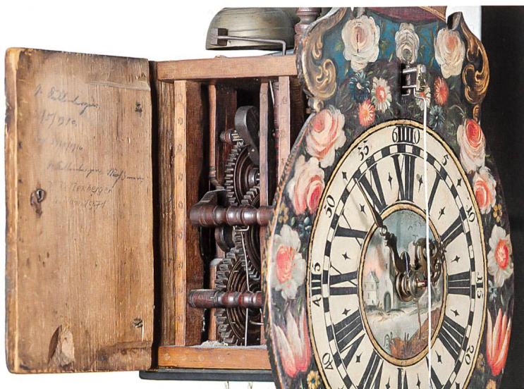
Appenzeller Holzräderuhr. Appenzell, 1768. Sign. 17 Joseph Guttman 68. Gehwerk mit Spindelgang, 4-Viertel- und Stundenschlagwerk. Inv. 3. Ein Merkmal im Werk einfacher Uhren von Guttman lässt doch eher auf den Uhrmacher schliessen. Diese haben eine Eigenheit am Hebel, der die Hammerwelle für das Schlagen bedient, die als «Guttman-Haarnadel» bezeichnet wird.