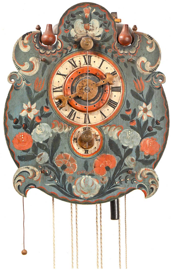
Toggenburger Holzräderruhr. Hemberg, um 1765. Zugeschrieben Franz Joseph Büchler. Gehwerk mit Spindelgang und Kuhschwanzpendel, 4-Viertel- und Stundenschlagwerk mit Schlossscheibe, Repetition der Stunden auf Abruf, Weckerwerk. Inv. 135. Die Büchler-Toggenburger Uhren sind unter den Holzuhren der Schweiz die einzig bekannten, die eine Schlossscheiben-Repetition haben. Auch bei Schwarzwälder Uhren gibt es die Repetition mit Schlossscheibe, aber in etwas anderer Ausführung. Franz Joseph Büchler war der bekannteste Toggenburger «Zytlimacher».