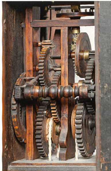
St. Galler Holzräderuhr. St. Gallen, 1784. Sign. Nr. 7 Weyerman à St. Gallen 1784. Niklaus Weyermann (1751–1829). Gehwerk mit Spindelgang, Stunden- schlagwerk. Inv. 11.