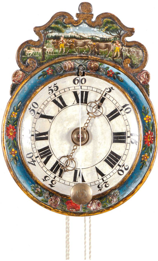
Kleine Appenzeller Holzräderruhr. Appenzell, um 1790. Gehwerk mit Spindelgang und Stundenschlagwerk. Legat Rosa Kellenberger-Zürcher. Inv. 346. Als Gangarten gibt es bei den Appenzeller Uhren von der Waag über die Spindelhemmung mit kurzem Vorderpendel bis zum Hakengang mit langem Pendel alle drei gängigen Hemmungsvarianten des 18. und auch 19. Jahrhunderts. Oft wird Zwetschgen- oder Birnbaumholz für das Räderwerk verwendet. Typisch für diese Gegend sind die charakteristischen Prägungen seitlich am Gestell.