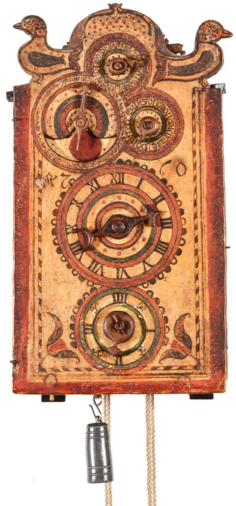
Bündner Holzräderuhr. Graubünden, 1760. Gehwerk mit Radunruhe, 4-Viertel- und Stundenschlagwerk, Wochentage, Monate, Mondphasen und Mondalterangabe. Inv. 129. Komplikationen wie Viertelstundenschlag oder Mondanzeige wie auf dieser Davoser Uhr waren nicht üblich. Sie ist das bis heute einzige bekannte Exemplar aus dem Sertigtal mit kalendarischen und astronomischen Anzeigen. Oben sind drei Hilfszifferblätter zu sehen, rechts für die Wochentage, oben für die Monate, links für die Mondphasen und das Mondalter. Die Uhr ist vermutlich nicht von den Ambühls hergestellt worden, aber sicher im Bündnerland entstanden.