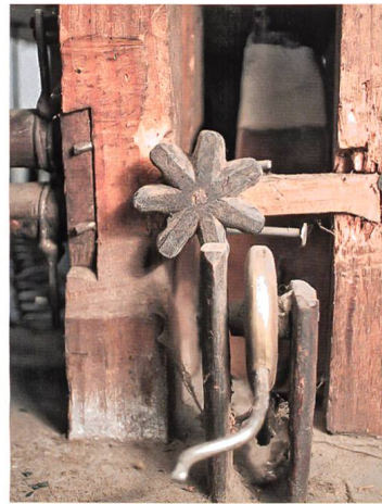
Holzräderuhr mit Figuren- automaten («Mülleruhr»). Neuenburg, 1752. Gehwerk mit Spindelgang, 4-Viertel- und Stundenschlagwerk, zwei Schlagfiguren und einem Flötenspieler. Inv.376.

macherei gegen Ende des 17. Jahrhunderts in La Chaux-de-Fonds und im Val de Travers immer mehr auf Metalluhren verlagerte, blieb im Val de Ruz, insbesondere in Fontainemelon, die Holzräderuhren-Herstellung bis etwa 1780 bestehen. Nach 1780 sank die Nachfrage in diesem Gebiet stark, da die Kleinuhrmacher Einzug hielten, deshalb sind Holzuhren aus dieser Gegend äusserst selten und als «Exoten» oft nur schwierig zuzuordnen. Bei der abgebildeten Holzräderuhr mit Figurenautomaten kann aufgrund einiger Merkmale der Gestaltung des Uhrkastens auf der linken Seite und wegen Konstruktionsmerkmalen des Gehwerks davon ausgegangen werden, dass sie im Val de Ruz hergestellt wurde.