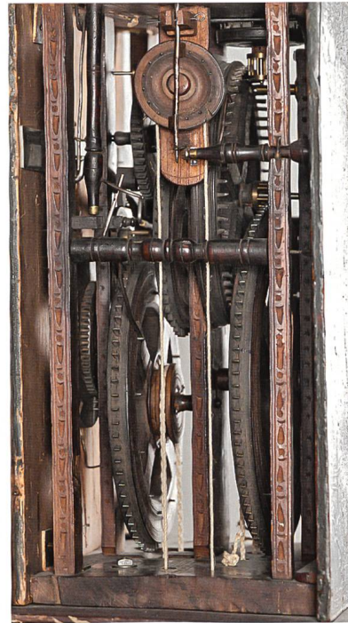
Appenzeller Holzräderuhr. Teufen, 1767. Sign. Emanuel Brugger, Teufen AR. 1767. Gehwerk mit Spindelgang, Stundenschlagwerk, Wecker, beide Werke auffallend grosse Holzräder mit eingesetzten Eisenzähnen, Bemalung mit Jahreszeiten, Symbolen der Vergänglichkeit und Sinnsprüchen. Inv. 4.