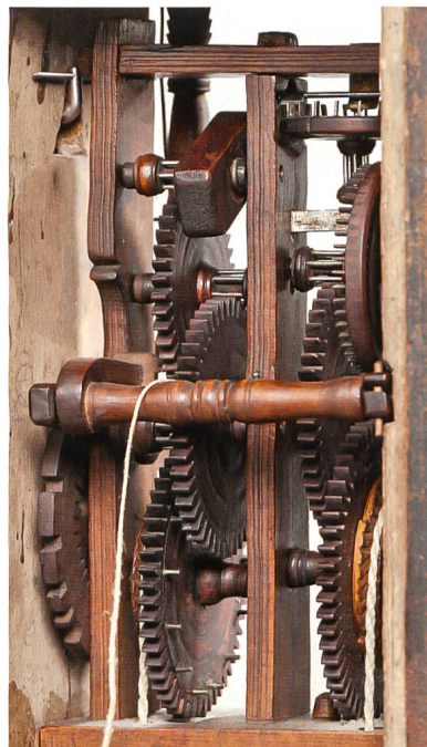
Schwyzer Holzräderuhr. Schwyz, 1797. Sign. 17 F. S. 97. Gehwerk mit Spindel- gang, Stundenschlagwerk mit Automat. Inv. 12. Das abgebildete Exemplar hat anstelle des normalerweise mit Ölfarbe bemalten Zifferblatts ein mit Papier beklebt und mit Aqua- rellfarben koloriertes Blatt.