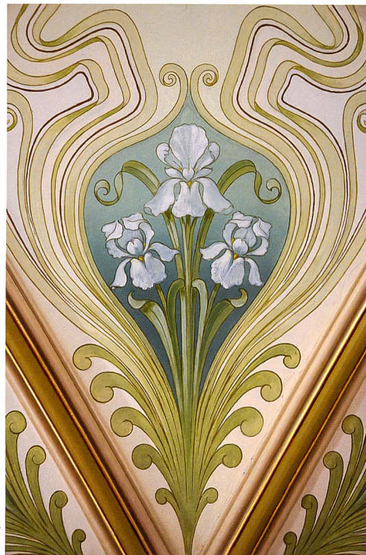
Blumenranken einer Jugendstildecke im 1. Obergeschoss der Villa Maria .