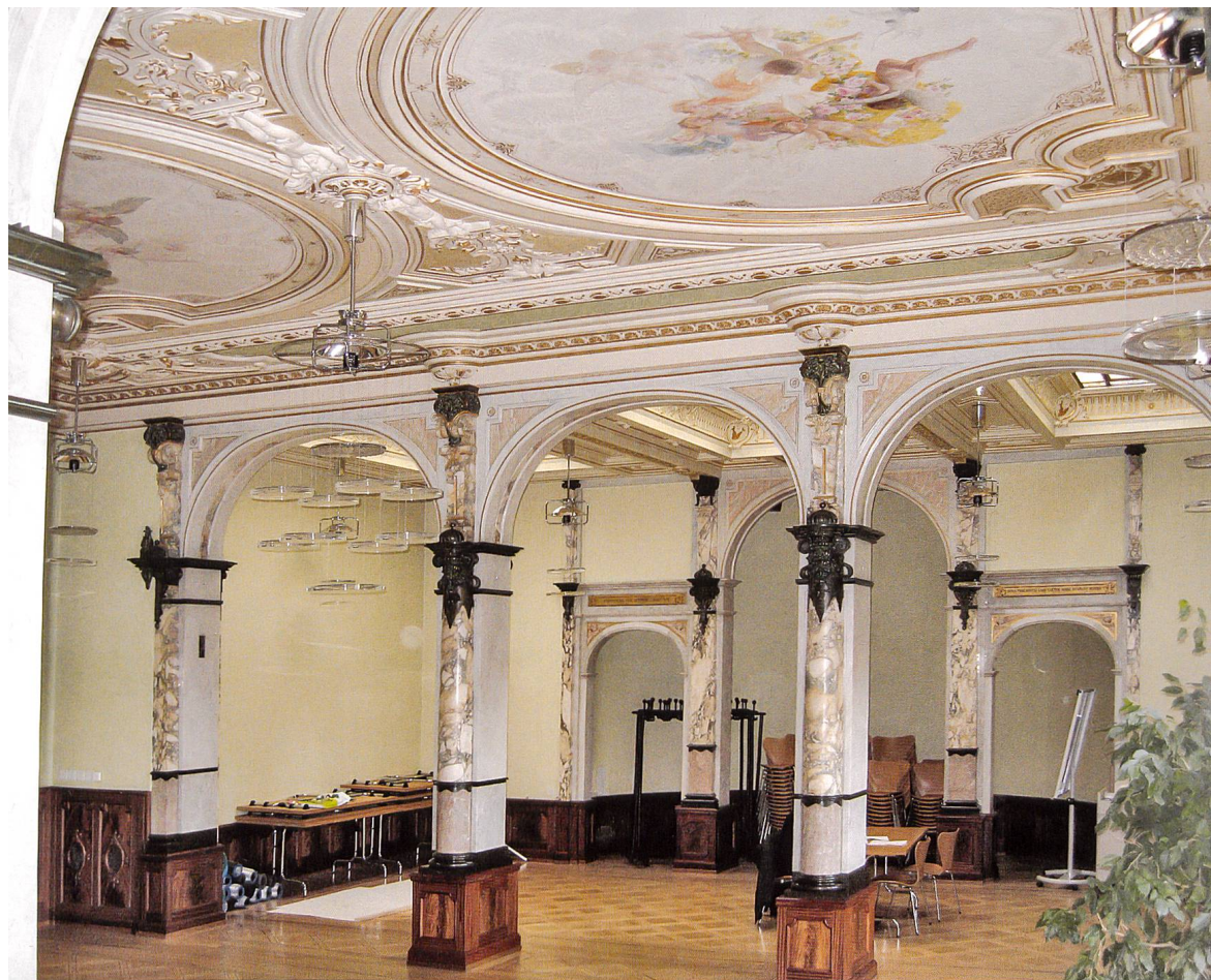
Der Ausstellungssaal (1904) im heutigen Liceo Artistico (Villa Dem Schönen) mit Dekorationsmalereien von Antonio De Grada.