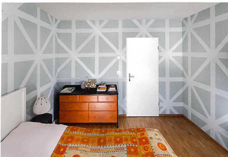
Dekorationsmalerei in hoher Perfektion im Schlafzimmer derselben Wohnung. Die bläulich weissen Bänder mit einem Glimmeranteil sind von Hand lasierend gezogen.