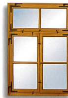
ZUM BEISPIEL_AUTHENTISCHE ZIERPROFILE IN ALTER HANDWERKSTRADITION

HISTORISCHE FENSTER UND TÜREN_STILSICHER UND DENKMALGERECHT ERNEUERN