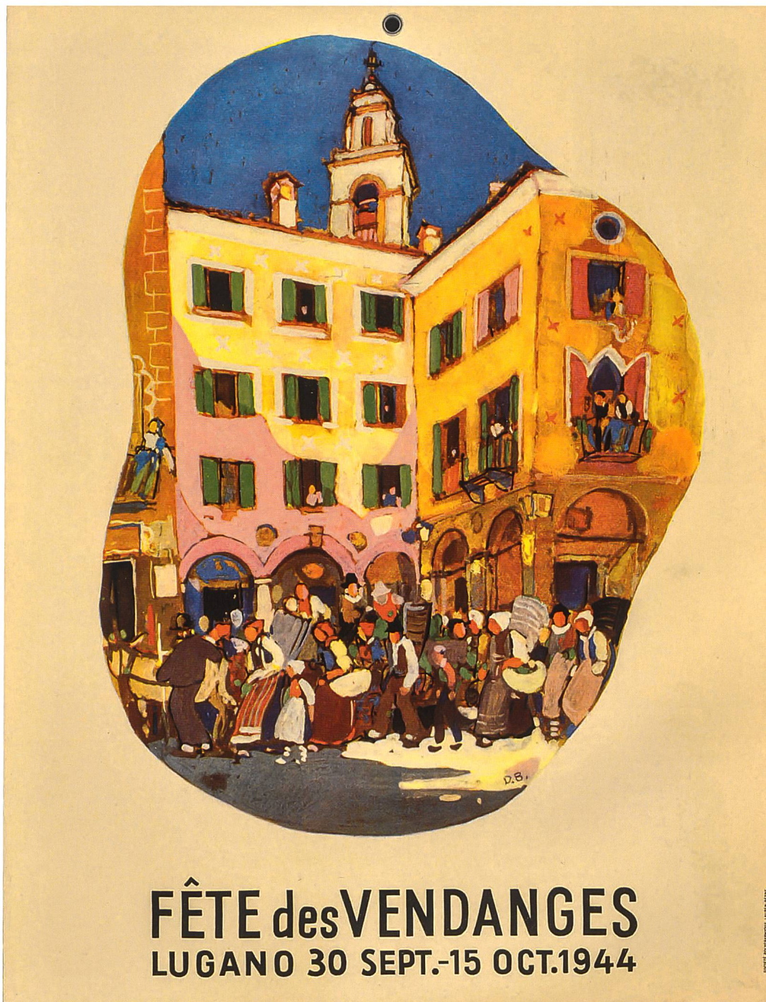
Daniele Buzzi, Manifesto per il Corteo della Vendemmia del 1943. Archivio storico della Città di Lugano, Fondo Fiera Svizzera di Lugano