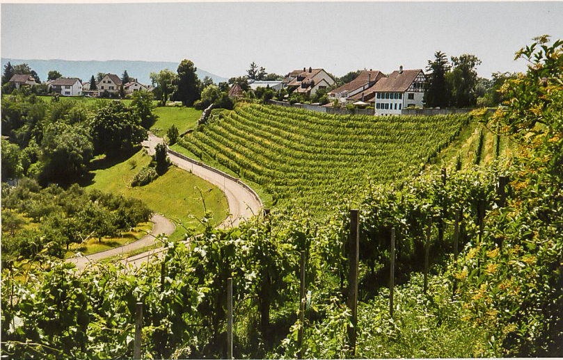
Zerstörung von Terrassenlandschaften durch grossflächige Planierungen im Rahmen der Rebmelioration von Miège in den 1980er-Jahren.