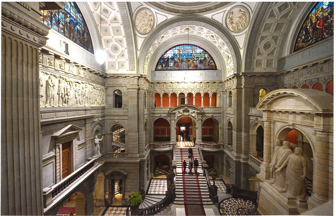
Ein «Showroom of the Nation»: die Kuppelhalle des Bundeshauses.

eigene Nation, die eigenen Errungenschaften. Zugleich bedarf es einer ständigen Rückversicherung über gemeinsame kulturelle oder historische Werte. Damals entstand auch das Schweizerische Nationalmuseum.