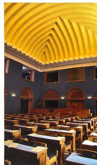
Der Parlamentssaal, Riigikogu-Gebäude, Tallinn, Estland, ist geprägt durch ein Zackenmotiv u.a. im Gewölbe (1920er Jahre).

Die Kuppel des Kapitols war für das amerikanische Phänomen der Zivilreligion kennzeichnend, weil sie Patriotismus und Religiöses vermengt. Auch Auer bekrönt den politischen Bau mit dem sakralen Motiv der Kuppel. Sie nobilitiert die räumlich-bildliche Inszenierung der nationalen Gemeinschaft im Inneren. Das ist symptomatisch für die Zeit um 1900 – eine Zeit der Bewusstseinswerdung über die eigene Geschichte, die