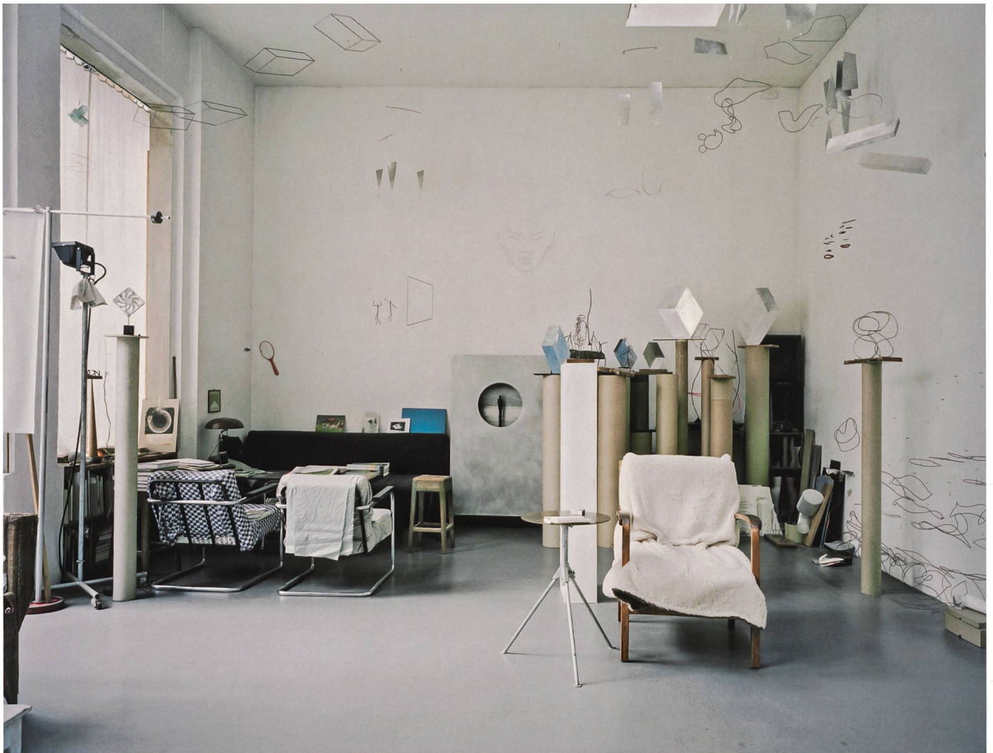
Das Atelier von Markus Raetz, Bern 2013.