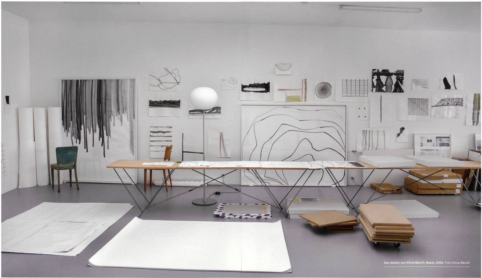
Das Atelier von Silvia Bächli, Basel, 2008. Foto Silvia Bächli