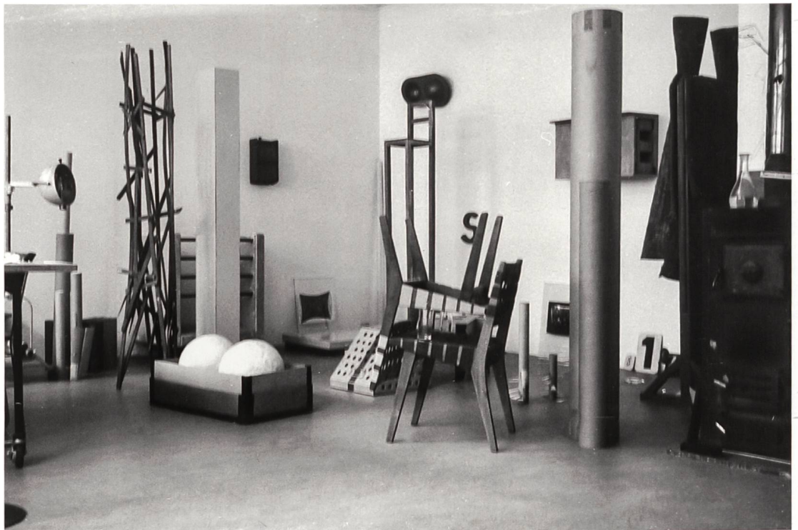
Das Atelier von Eric Hattan, Basel 1993.