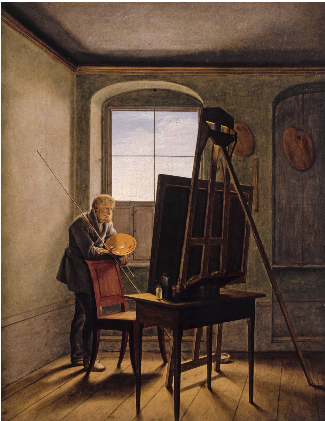
Georg Friedrich Kersting: Caspar David Friedrich in seinem Atelier (1812), Kunsthalle Hamburg, Öl auf Leinwand, 54 x 42 cm

Hinweis darauf, dass die Romantik aber doch noch nachwirkt, mutet es an, wenn Heinrich Lee, wie Kellers Titelheld mit seinem bürgerlichen Namen heisst, anfänglich bei einem Maler in die Lehre geht, der sein Atelier in einem aufgelösten Kloster untergebracht hat. Dieser Lehrmeister ist selbst noch dem alten Konzept verhaftet und lässt es geschehen, dass sich Heinrich bei seinen Naturstudien eher von der eigenen Phantasie als von den Naturgegenständen leiten lässt.