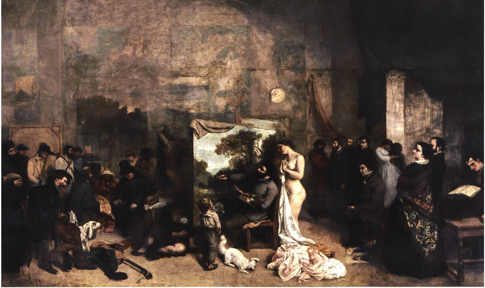
Gustave Courbet: L'atelier (1855) , Paris, Musée d'Orsay, Öl auf Leinwand, 361 x 598 cm

Die Wäsche, ein beliebtes Versatzstück der Römer Vedutenmalerei, liefert Keller den Stoff für die Inszenierung der Ernüchterung, in die er auch diese Künstlergeschichte münden lässt. Das Atelier des Bildhauers ist in einer Wäscherei untergebracht, die der Mutter von dessen Geliebter gehört. Hier wird just am Tag von Herrn Jacques' Besuch die fröhliche Hochzeit des jungen Paares gefeiert. Der Mäzen fragt irritiert nach der Statue eines durstigen Fauns, von dem ihm sein Schützling berichtet hat. Dieser zeigt verlegen auf eine «geheimnisvoll verummte Gestalt». «Ganz nahe ließ sich dem Geheimnis jedoch nicht beikommen wegen eines Haufens Kartoffeln und anderen Gemüses, das davor und darunter lag. Nachdem der Bildhauer einen Fensterladen aufgestoßen, fiel das Licht auf eine mit eingetrockneten Tüchern umwickelte Tonfigur, und jener arbeitete sich durch die Kartoffeln, um letztere der Hüllen zu entledigen. Mit den Tüchern fiel ein abgedorrtes Ziegenohr des Fauns herunter und mehr als ein Finger der erhobenen Hände. Endlich kam der gute Mann zum Vorschein; das gierig durstige Gesicht war herrlich motiviert durch den wie ein dürres Ackerland zerklüfteten Leib, der den wohlthätig anfeuchtenden Wasserstaub seit vielen Wochen nicht verspürt haben mochte. [...] Alle betrachteten erstaunt diese vertrocknete Unfertigkeit; [...]» 7