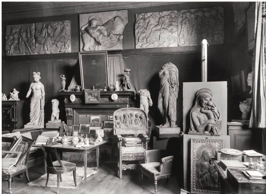
Fig. 3 Anonyme, Intérieur de l'atelier du peintre Etienne Duval , photographie. Bibliothèque de Genève, Centre d'icongraphie genevoise