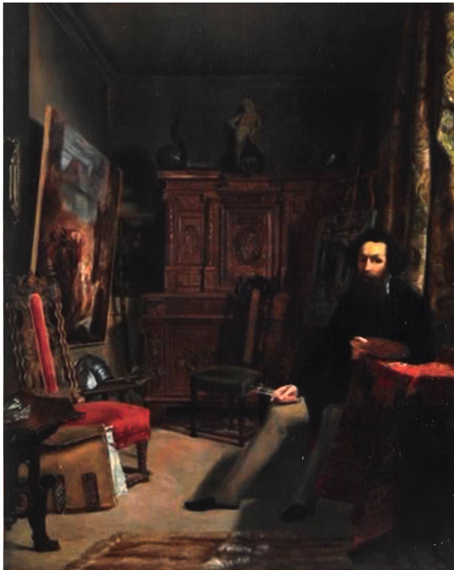
Fig. 2 Alexandre D'Albert-Durade, Atelier de Joseph Hornung , 1861, huile sur toile, 79 × 63,5 cm. Marché de l'art

La quête de l'identité nationale à l'époque romantique, friande de représentations légendaires et héroïques des temps primitifs du pays, incite les artistes à récupérer dans leurs ateliers des objets médiévaux et de la Renaissance. Ils suivent les modes des collectionneurs, tels que Jean-Jacques Rigaud 2 , et des artistes étrangers (par exemple Charles Giraud, Atelier de peintre, souvenir , 1853, Compiègne, musée national du château). Joseph Hornung, particulièrement attaché aux goûts