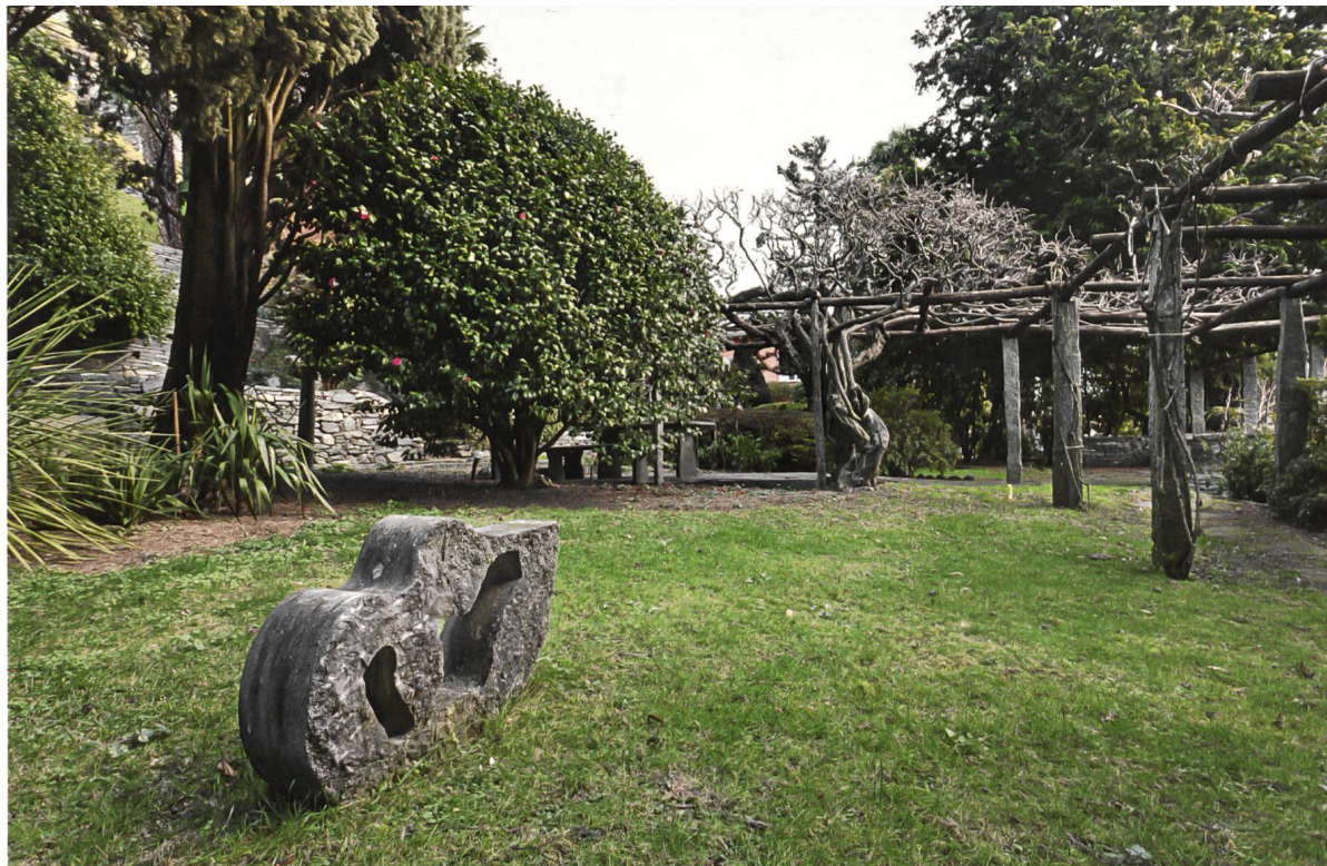
Blick vom Garten auf das Atelierhaus, 2015.