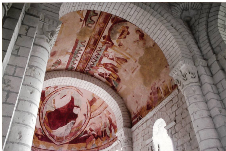
St-Nicolas de Tavant, Fresken aus dem 12. Jahrhundert

Benedikt Loderer konstatiert einen Riss, der durch die Schweiz geht: ein Riss zwischen «Schönschweiz» und «Verbrauchsschweiz» sowohl in der Landschaft wie in den Köpfen der Menschen. Tourismusorte haben in diesem Spannungsfeld einen besonders para-