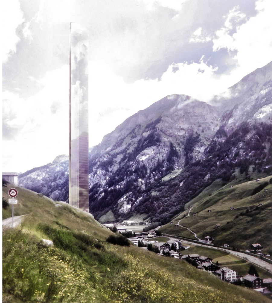
Ill. 7: La torre più alta di Europa. Rendering del grattacielo progettato a Vals, Grigioni (2015).

ecologia, tutela, restauro, beni culturali e quant'altro. Lo scopo di tutto questo è uno solo: lo stupro. Ma siccome nessuno stupratore confessa di esserlo, e meno ancora vuol farsi cogliere sul fatto, ecco che i capaci petti di deputati e commendatori si gonfiano di obiettivi e metafore, alta retorica e fervore lirico». 10