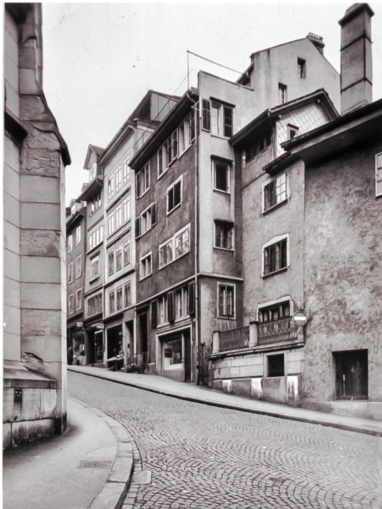
Abb. 7/8 Ersatzneubau im Rahmen der Altstadt-sanierung an der Kirchgasse 24: das abgebrochene Haus «zur Musegg» und der Neubau von Max Kopp, 1956 (Aufnahmen 1955/1963).