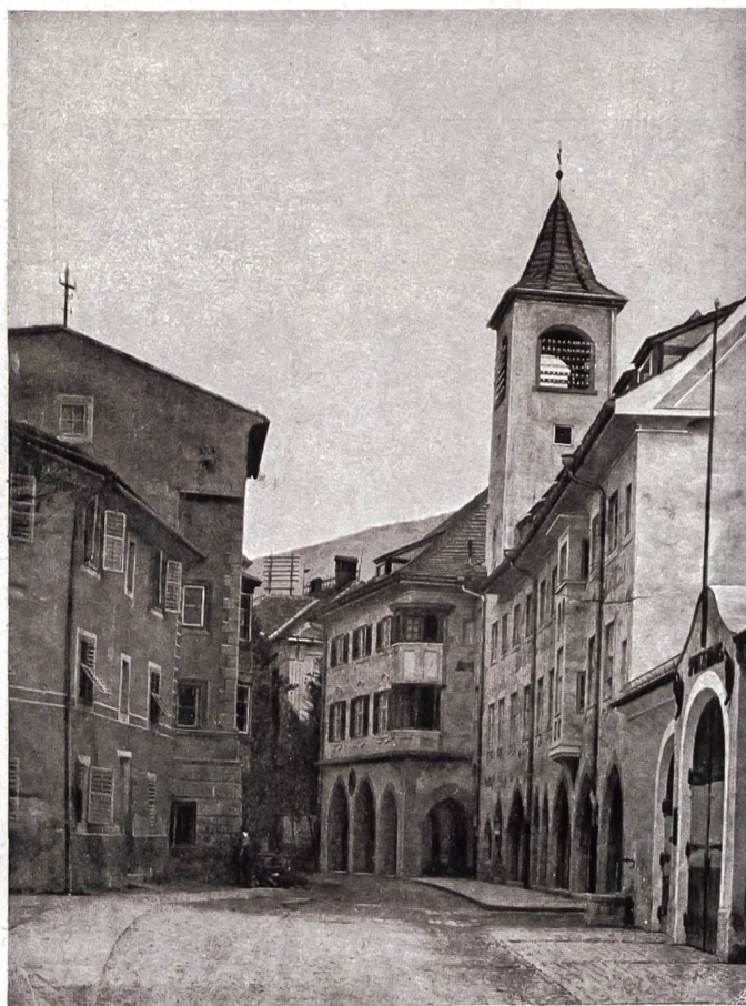
Abb. 133. Das neue Postgebäude (von Th. Fischer) in Hall in Tirol.

Der österreichische Architekt und Historiker Friedrich Achleitner schrieb im Hinblick auf den Heimatstil der Zwischenkriegszeit einmal: «Das ideologische Bindemittel dieser Baukultur ist jedoch flüssig, es ist, wie wir alle wissen, das