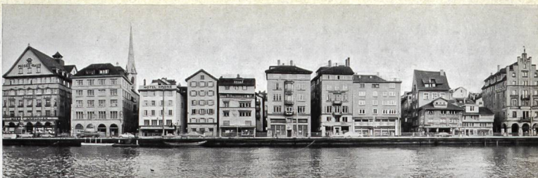
Der Limmatquai, wie er sich von der Schiffe aus gesehen heute darstellt.

Auf dem unteren Bild wurde ein als ‚guter Neubau‘ ausgezeichnetes Geschäftshaus aus dem Sihlquartier versuchsweise an den Limmatquai versetzt (Photomontage). Die unerfreuliche Wirkung ist offensichtlich: der viel zu große Bau stört den Maßstab, die horizontale Gliederung widerspricht der vertikal geteilten bisherigen Bebauung. Auch die Baustoffe Glas und Stahl sind hier am falschen Ort.