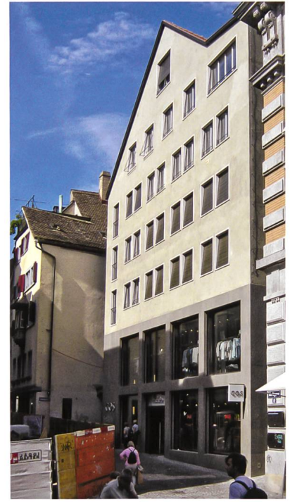
Abb. 13 Häuser (zum Goldenen Schwert) und (zur Apotheke), Marktgasse 12/14, abgebrochen im Rahmen der Altstadtsanierung 1949.