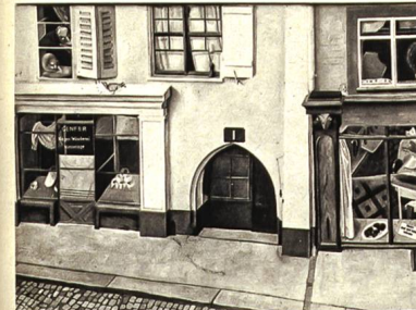
NIKLAUS STÖCKLIN, BASEL RHEINGASSE 1 ÖLBILD

geringen Geschosshöhen von Erdgeschoss und 1. Stock reichten eben aus, um ein ordentliches Verkaufsal mit Galerie als Arbeitsraum einzubauen — die Fensterreihe über dem Erdgeschoss zeigt deutlich diese Veränderung der Bestimmung. Der zweite Stock wurde zum Wohn-, der dritte zum Schlafgeschoss hergerichtet. Der Umbau ist im Jahre 1921 durchgeführt worden.