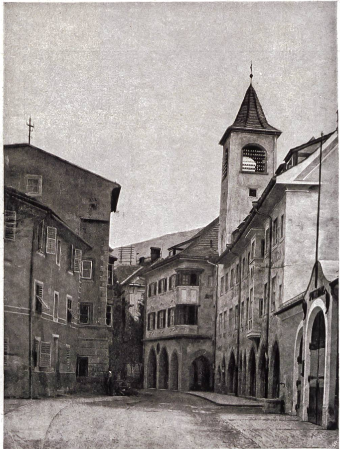
Abb. 133. Das neue Postgebäude (von Th. Fischer) in Hall in Tirol.

Der österreichische Architekt und Historiker Friedrich Achleitner schrieb im Hinblick auf den Heimatstil der Zwischenkriegszeit einmal: «Das ideologische Bindemittel dieser Baukultur ist jedoch flüssig, es ist, wie wir alle wissen, das