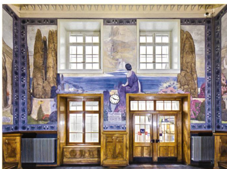
Biel → 5