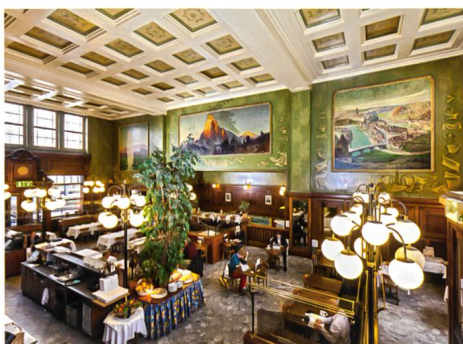
Lausanne → 19