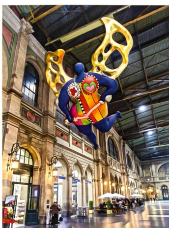
Zürich → 57