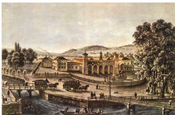
Ansicht des Bahnhofs Zürich von der Limmatseite, 1847.

Dieses neue Buch stellt die Planungs- und Baugeschichte des Zürcher Hauptbahnhofs von den Anfängen bis zur Gegenwart in Text und Bild umfassend dar. Reich illustriert mit historischen und neuen Fotos, Originaldokumenten sowie zahlreichen Plänen, beschreibt der Band ausführlich nicht nur die Publikumsanlagen und das unmittelbare städtebauliche Umfeld, sondern thematisiert auch die Einbindung ins regionale Schienennetz und die betrieblichen Anlagen im Vorbahnhof. Aufgezeigt wird auch, welche nicht realisierten Projekte – wie das einer U-Bahn in den 1970er Jahren – in Teilen zur heutigen Anlage führten. ●