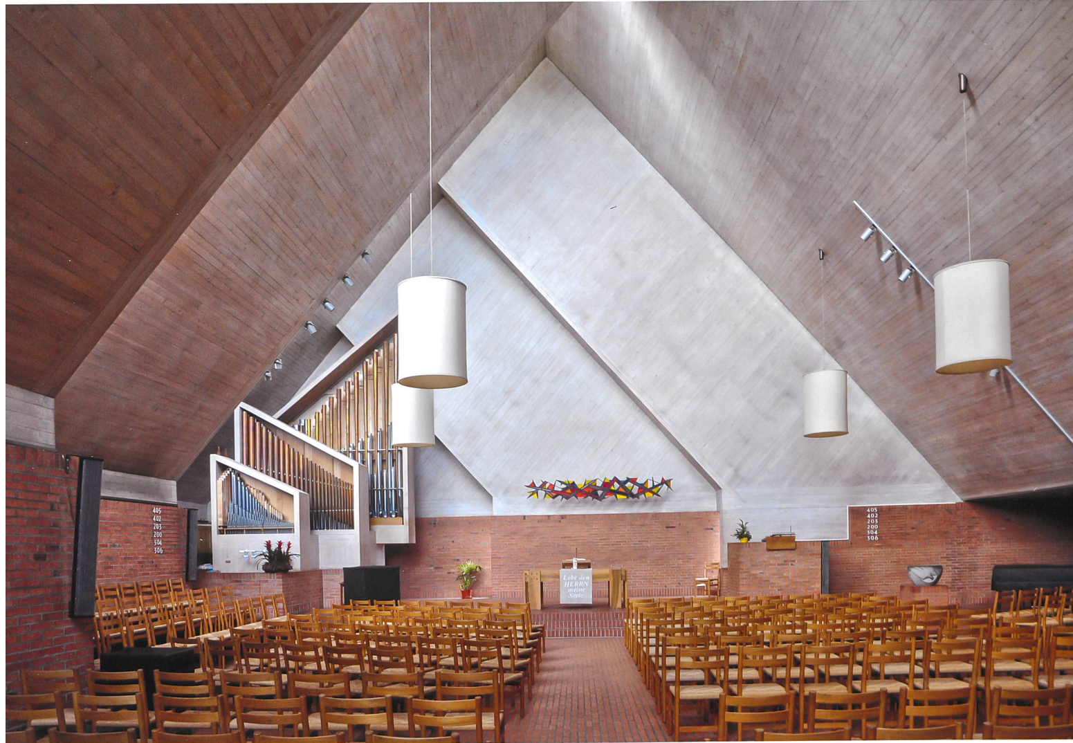
Innenraumgestaltung um 1960: Effretikon, reformierte Kirche, Ernst Gisel 1959–1961.