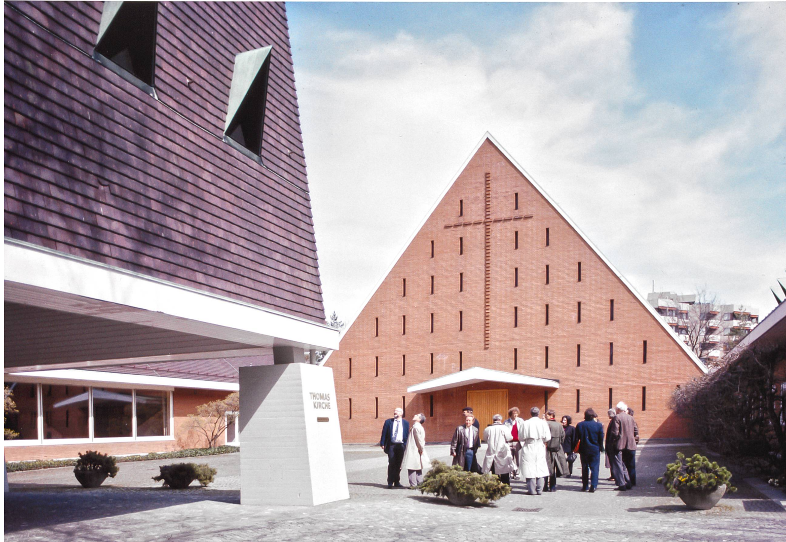
Zurückhaltend gestaltetes Gemeindezentrum: Zürich, Thomas Im Gut, Hans Hofmann 1959–1961.