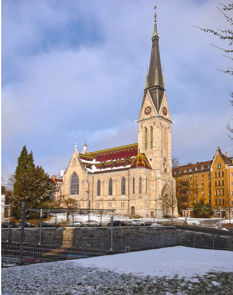
Abb.9 Kirche St. Leonhard in St. Gallen, 2005 an einen Architekten verkauft, seither ungenutzt.