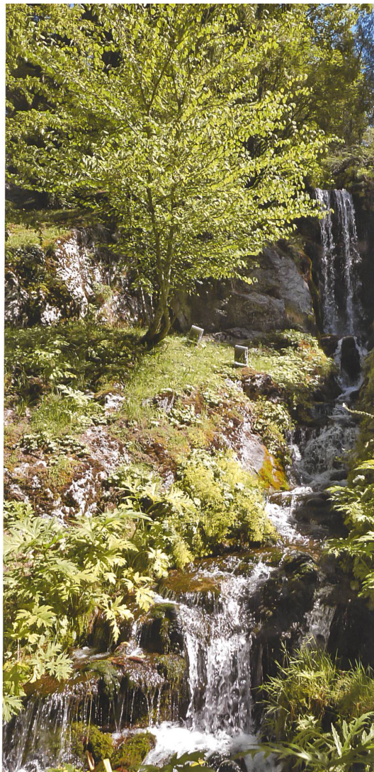
Fig. 14 Le jardin alpin de La Jaysinia tel qu'il se présente actuellement.

Si La Jaysinia (fig. 14) se déploie dans un cadre enchanteur, bucolique, que l'on jugerait presque naturel, il a pourtant fallu plus de trois ans et plus de 250 employés pour parfaire ce chef-d'œuvre. La dynamite creuse, morcelle et sculpte la roche à 700 m d'altitude, les escaliers sont taillées à même la pierre, l'eau jaillit, d'un débit de 50 litres par seconde, d'une cascade