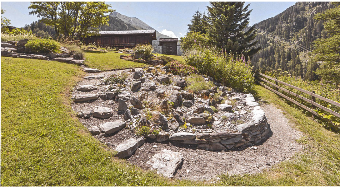
Fig. 5 Les nouveaux aménagements de La Linnaea à Bourg-Saint-Pierre réalisés par l'équipe du secteur Rocailles des Conservatoire et Jardin botaniques de la Ville de Genève. Actuellement le jardin alpin occupe le haut de la butte, alors qu'à l'origine, il était aussi installé sur la pente en direction du Nord.

géologiques. A la fin du XIX e siècle, des contestataires, paysagistes ou poètes, plaident contre les rochers artificiels. Le jardin anglais dit «sauvage» avec William Robinson (1838-1935) comme chef de file, prend tellement d'ampleur que l'entreprise Pulham & Son abandonne la simili-pierre et que l'on assiste au retour de la pierre naturelle 7 .