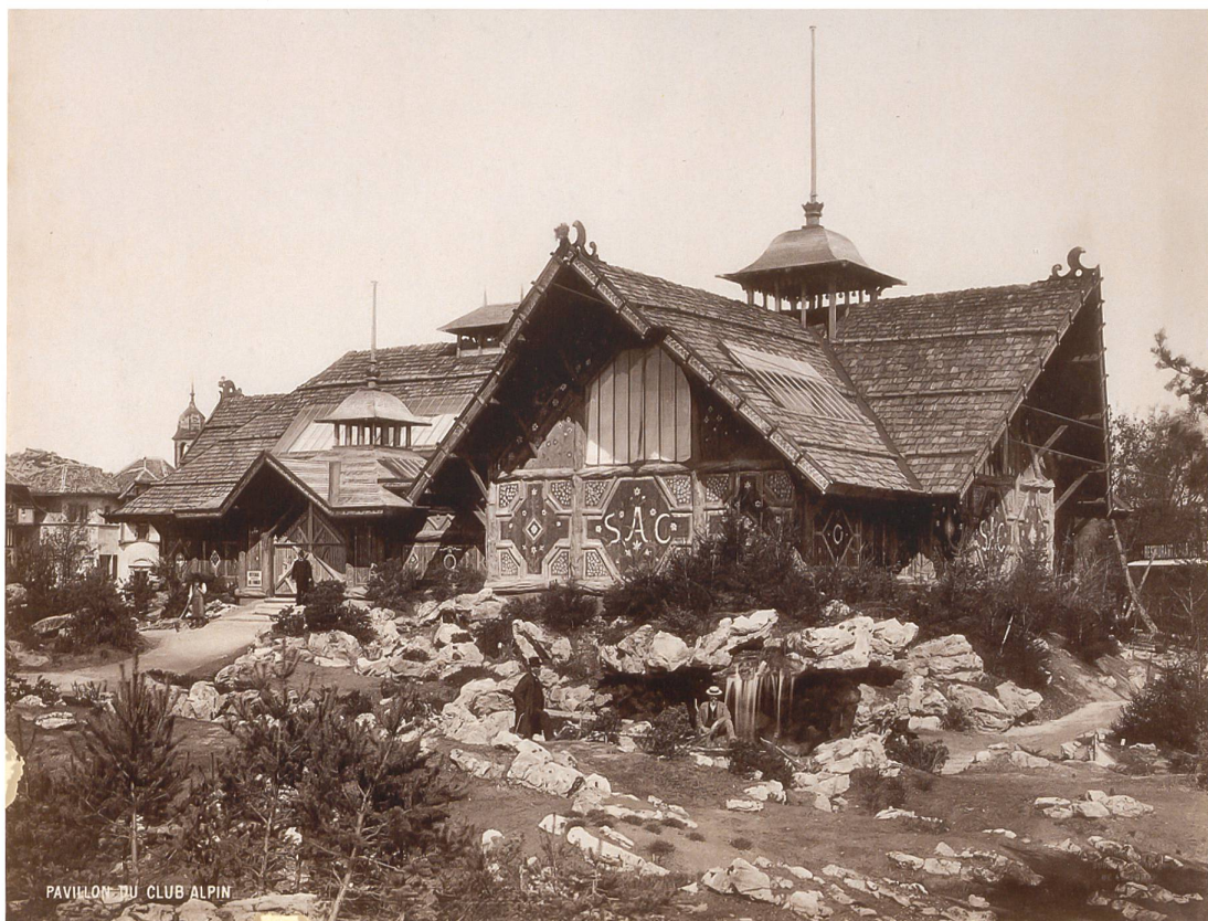
Fig. 13 Encart publicitaire de Jules Allemand, architecte-paysagiste, qui fait des « constructions spéciales de jardins alpins ». Tiré de Journal officiel illustré de l'Exposition nationale suisse , 31 décembre 1896, n° 50