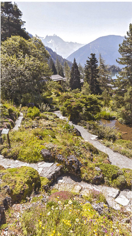
Fig. 15 Vue actuelle du jardin Flore-Alpe . Au fond, le lac de Champex.