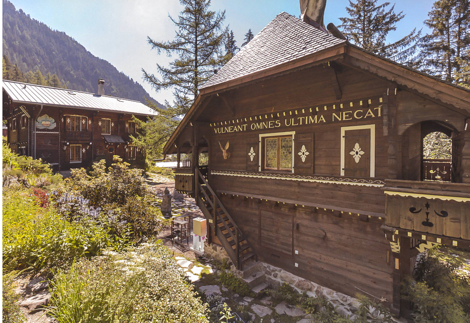
Fig. 16 Vue actuelle du grand chalet et du petit chalet, au bas de Flore-Alpe à Champex-Lac VS. De nos jours, ils accueillent le public mais également des groupes venant étudier la botanique, qui peuvent loger sur place.