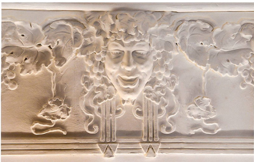
Brasserie de l'Inter. Le plafond d'origine après enlèvement du faux plafond et avant restauration.