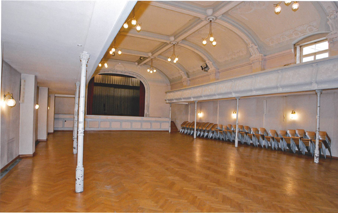
La grande salle de l'Inter, avant travaux de restauration. Municipalité de Porrentruy, photo Darrin Vanselow