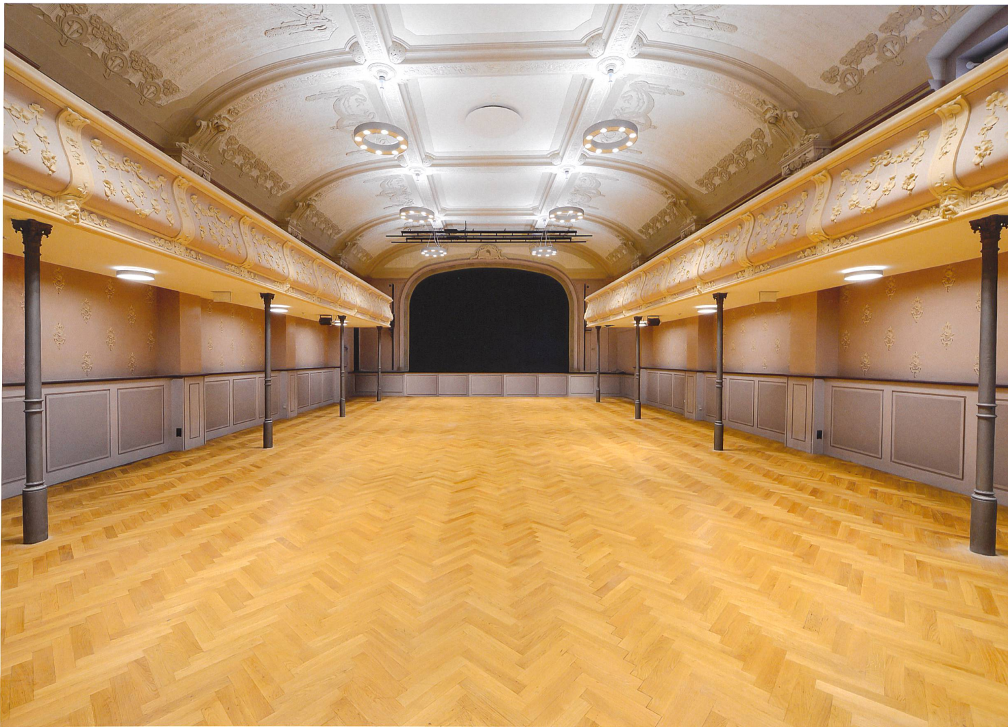
La grande salle de l'Inter, après restauration. Municipalité de Porrentruy, photo Géraud Siegenthaler