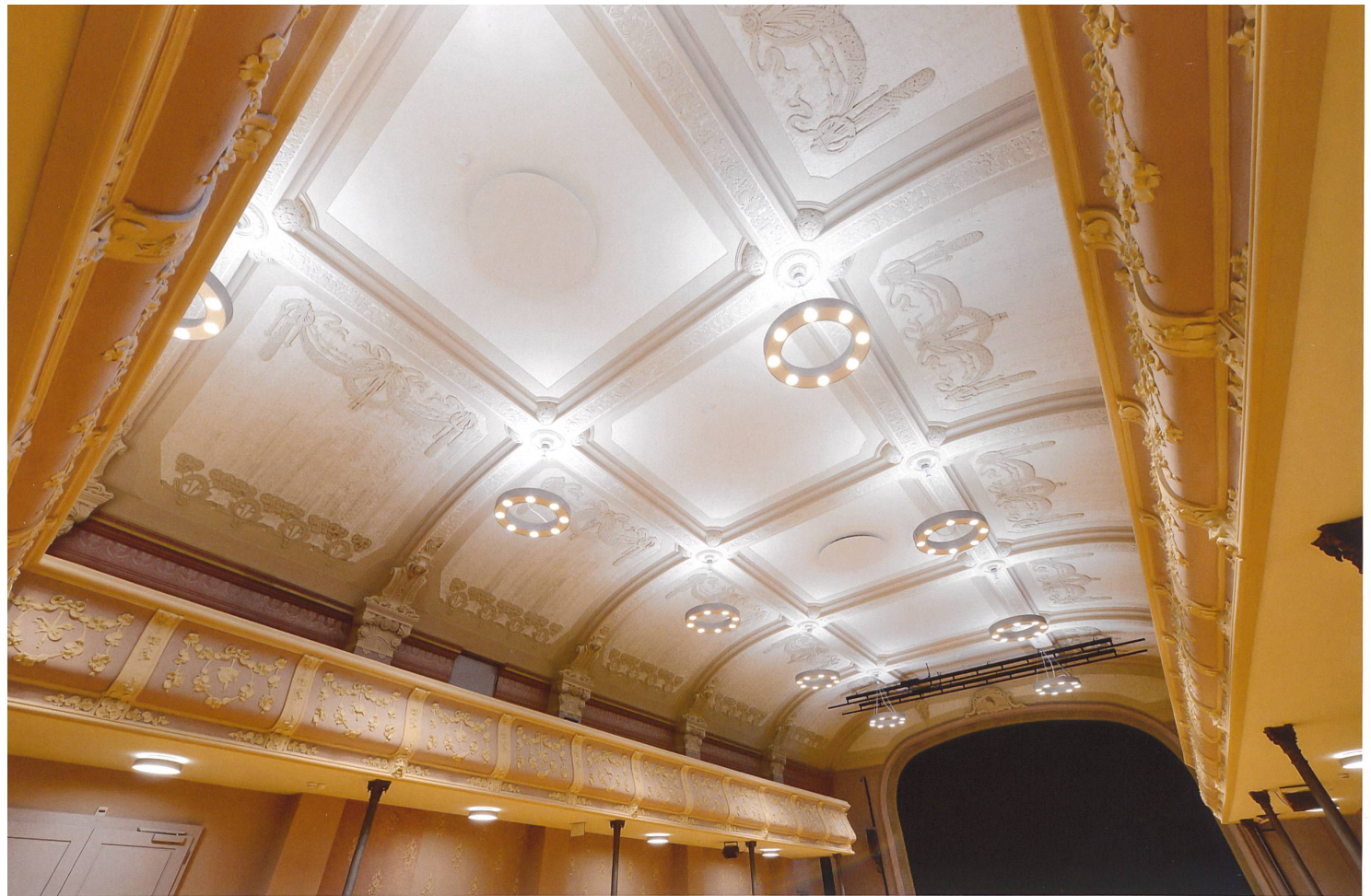
Grande salle de l'Inter. Le plafond après restauration.

de la société. La nouvelle cage de scène de dimensions très importantes était nécessaire au projet et devait dès lors être acceptée. Elle se présente dans la vieille ville, à la rue Pierre-Péquignat, en tant qu'exception, comme un grand volume presque entièrement fermé, avec seulement une grande porte pour le transport du matériel en coulisses. Les façades ont été enduites et peintes dans une teinte qui tient compte des bâtiments environnants pour s'intégrer dans leur cadre 7 . Pourtant elles ne cachent pas la vocation du bâtiment : elles sont structurées avec de légers ressauts en relation avec les installations et usages des galeries à l'intérieur. Des fenêtres à chaque étage ainsi que des petites ouvertures au dernier niveau donnent une lumière naturelle aux galeries et aux cintres au-dessus de la scène. Ainsi, le grand volume fait écho aux maisons voisines, sans toutefois occulter sa fonction particulière.