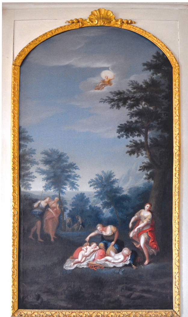
Fig.5 Les Amours désarmés par les nymphes de Diane , peint d'après L'Albane, attesté dès 1760 dans le petit salon du château d'Hauteville