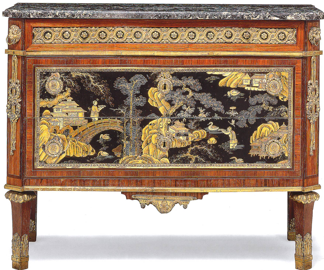
Fig. 11 Paire d'encoignures, à structures portantes en bois de placage et panneaux de laque de Chine et laque du Japon, estampillées par Jean-Jacques Mantzer, Paris, vers 1770, 89×78×48 cm. Les placages sont en bois de violette, en amarante et en bois fruitier, les plateaux en marbre brèche d'Alep, les garnitures en bronze doré.