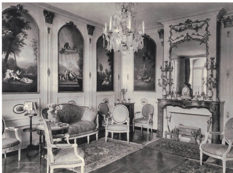
Fig. 3 Photographie du petit salon tirée d'un album de famille, vers 1900-1905