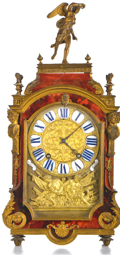
Fig. 8 Cartel en placage d'écaille rouge et garniture en bronze doré, surmonté d'une Renommée, Paris, vers 1700, 74 × 35 × 15 cm. Mouvement et cadran à douze cartouches émaillés dus à Nicolas Gribelin, reçu maître à Paris en 1675.