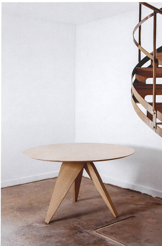
Noch ein runder Tisch, 2013, legno di quercia. Edition By Moyard.

La lampada, creata con LifeGoods per la galleria Ormond, è stata esposta a Colonia e presentata nel corso della rassegna ticinese per il design «Artificio». Ha ottenuto un ottimo riscontro dalla critica assicurandosi pubblicazioni in alcune tra le più importanti riviste del settore.