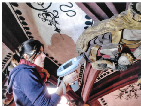
Bern → 61