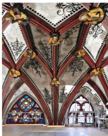
Bern → 71