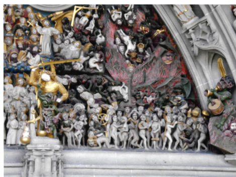
Bern → 76