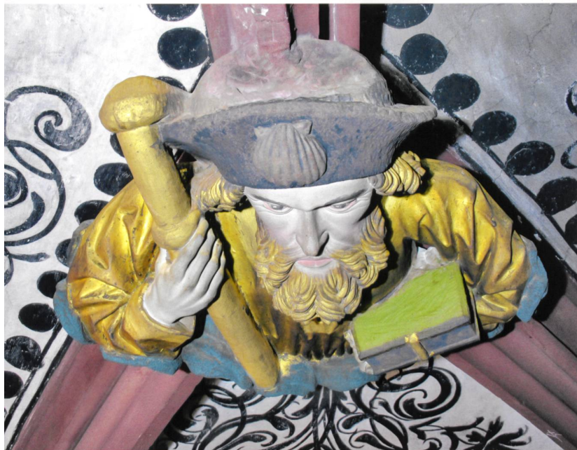
Abb. 9 Schlussstein Nr. 75 (Jakobus d. Ältere) im ungereinigten Vorzustand mit dicken Staubauflagen.