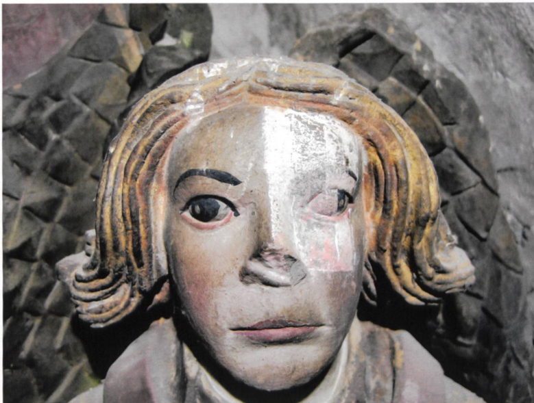
Abb. 1 Auf der Suche nach einer ursprünglichen Fassung unter der sichtbaren wurde ein Engel im Chorgewölbe 1990 bei Probeentnahmen und einem Freilegungsversuch irreversibel beschädigt.