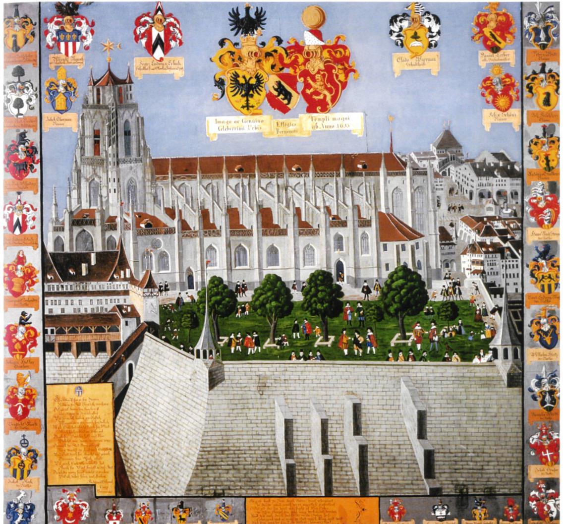
Abb. 3 Berner Münster mit Rathaus, Antoni Schmalz 1617 (Bernisches Historisches Museum). Im rechten Teil dieses aufschlussreichen Gemäldes ist die Verbindung durch die Kreuzgasse vom Münster zum Rathaus sehr gut auszumachen. An der Kreuzung Gerechtigkeitsgasse steht das Gehäuse des spätgotischen Richtstuhls als Teil der politischen Topographie Berns.

begonnen und zum Teil schon erbaut worden ist, und dass für die Mauer, die den Hügel umspannt, über der auf anderen Fundament die Kirche gestellt werden soll, 50000 Gulden von der Kammer ausgegeben worden sind und noch zweimal so viel vor der Vollendung des Werks ausgegeben werden.» 6 Diese Quelle verweist nicht nur auf das enge Verhältnis zum Papst, der nach der Anwesenheit König Sigismunds 1414 drei Jahre später in der Aarestadt weilte, sondern bringt den Baubeginn des Münsters in engen zeitlichen Rahmen mit dem 1417 vollendeten Rathaus. Man darf beide Bauten als programmatischen Ausdruck des gesteigerten Repräsentationsbedürfnisses der aufstrebenden Freien Stadt Bern sehen, die sich sowohl mit dem Rathaus als auch dem Münsterbau in die erste Reihe der schwäbisch-alemannischen und oberrheinischen Reichsstädte stellen wollte (Abb. 3).