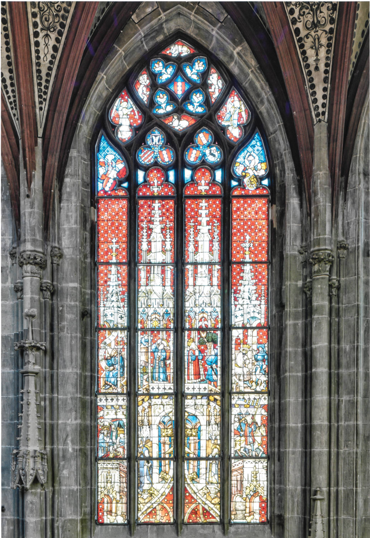
Abb. 9 Bern Dreikönigsfenster obere Zone (Bern Münster Polygon, Joch NII). Die grossformatigen gemalten Architekturelemente bilden ein eigenes System aus, das mit der Architekturgliederung in Verbindung tritt. Gleichzeitig bieten die Baldachine eine Bühne für die Szenen der Dreikönigslegende. Formal stehen sie in Korrespondenz mit dem monumentalen Dreisitz im südlichen Polygon.