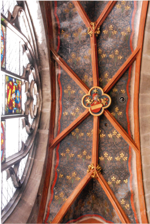
Abb. 7 Bern, Münster Brüglerkapelle Südseitenschiff, östlichste Kapelle zwischen 1432 und 1451. Die privat gestifteten Einsatzkapellen des Münsters garantierten den Baufortschritt, waren aber auch Repräsentationsort der Berner Elite und standen für eine Corporate Identity.