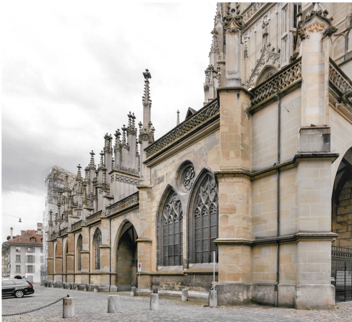
Abb. 2 Bern, Münster Nordseite. Dieser noch weitgehend im originalen Zustand befindliche Teil des Münsters zeigt den hohen Anspruch des Berner Neubaus. Neben dem reichen Strebewerk und dem Doppelfenster Prager Prägung stechen die breiten Fenster und die grossen Portale mit ihren Vorhallen ins Auge.

einen Spezialisten, der jüngst ein Buch zur Steinbearbeitung im Mittelalter vorgelegt hat. 4 Neben der im Rahmen des Projekts durchgeführten Analyse der Steinbearbeitung bildet ein Hauptuntersuchungsfeld die bauforscherische Untersuchung des Baus durch Alexandra Druzynski v. Boetticher, wie sie seit den Untersuchungen zum Bamberger und Regensburger Dom zum Standard gehören. 5 Waren die Photogrammetrien zur Baudokumentation und Schadenkartierung im laufenden Bauunterhalt verwendet worden, benutzt die Bauforschung diese Grundlage, den Bau erstmals genau zu autopsieren mit dem Ziel, den Bauverlauf im Detail zu rekonstruieren. Verschiedene Bereiche oberhalb der Gewölbe und im Westbau wurden dazu zusätzlich neu aufgenommen. Dabei ist festzuhalten, dass nach dem Chorbau unter Einschluss der alten Nordwand (um 1440 fertiggestellt) das Langhaus ohne Obergaden und Mittelschiffsgewölbe, aber mit den kompletten Seitenschiffen und Einsatzkapellen bis um 1470 fertiggestellt wurde und auch die Westfassade zu diesem Zeitpunkt in der jetzigen Form weit vorangeschritten war (Abb. 1).