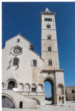
San Nicola Pellegrino