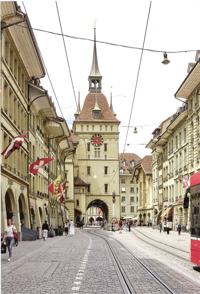
Der Käfigturm in der Berner Altstadt.