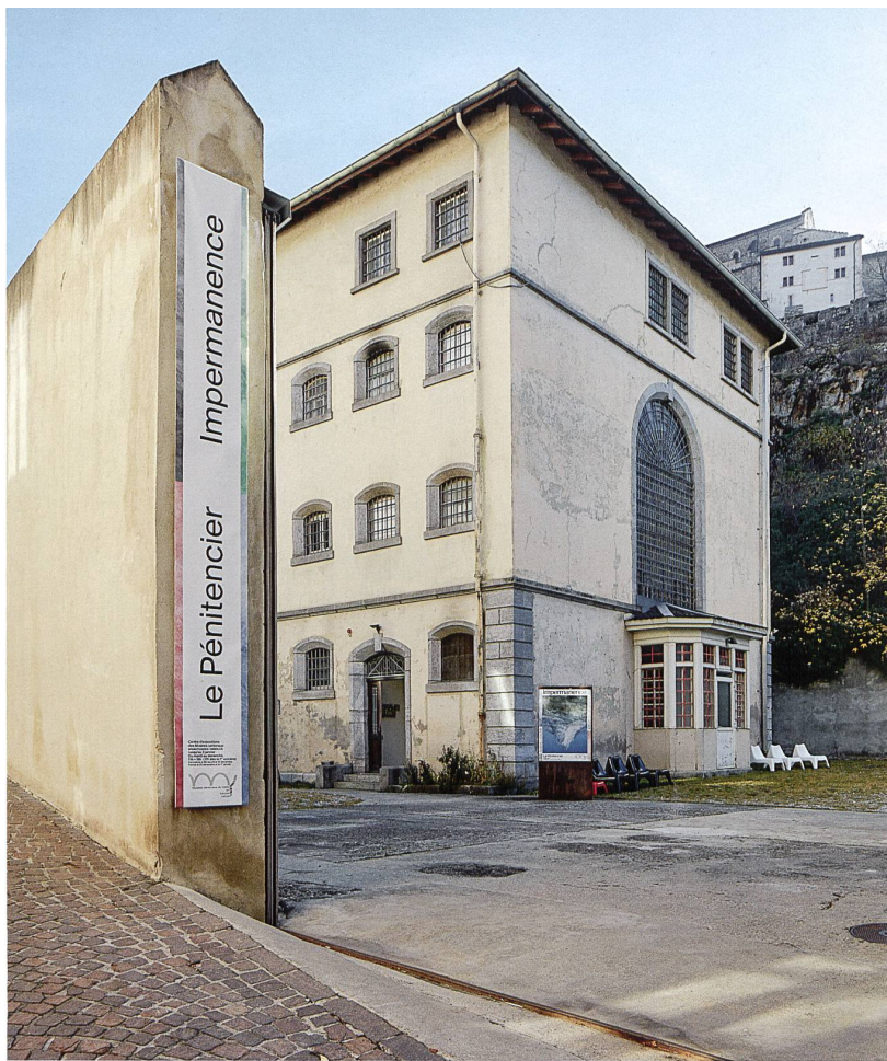
Das ehemalige Gefängnis Le Pénitencier in Sitten: 1997 stillgelegt, seit 2000 Ausstellungszentrum der Walliser Kantonsmuseen.

der Wand verschraubter, klappbarer Tisch, zwei Bänke sowie eine Kloschüssel hinter einem Schamwändchen. Zudem sind die cremefarbenen Wände mit zahlreichen Kritzeleien ehemaliger Insassen verziert. Die Ausstellungen, die im Museum für Musik stattfinden, erlangen zwar international Beachtung, so richtig akzeptiert ist das Museum in der Basler Bevölkerung aber immer noch nicht – es scheint, als ob in dem ehemaligen Gefängnis nach wie vor die einstigen Gespenstersonaten gespielt würden. Ein Abriss und Neubau wäre von der Bevölkerung möglicherweise besser akzeptiert worden.