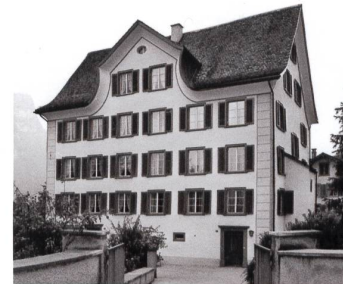
Südfassade des Schindlerhauses/Försterhauses in Mollis (Schulstrasse 2/4). 1719/20 für Landessäckelmeister Conrad Schindler erbautes Doppelwohnhaus mit Quergiebel von 1820.

Die Architektur und Kultur des Glarner Unterlandes wurde sozial- und wirtschaftsgeschichtlich durch verschiedene Persönlichkeiten geprägt. Ihre Gesichter sind uns über Portraits, die meist bei auswärtigen Malern in Auftrag gegeben wurden, überliefert: darunter das Stifterportrait des Jost Brändle aus der Dreifaltigkeitskapelle Oberurnen, die Näfeler Bildnisse Gallati, Hässi und Freuler aus dem 17. Jahrhundert im Freulerpalast oder die Molliser Ehepaarbildnisse Zwicky und Schindler.