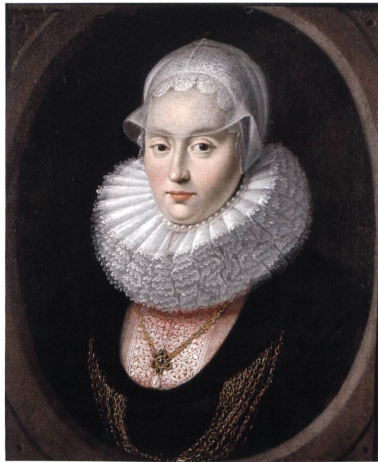
Portrait der Margareta Freuler-Hässi (1599–1640), erste Gattin von Caspar Freuler. Unsigniertes Ölgemälde um 1625. MdLG Inv. 990. Foto Schönwetter, um 1980

Insbesondere bei Grossbauten lassen sich interessante baukulturelle Unterschiede zwischen den beiden Konfessionen feststellen: Protestantische Bauherren orientierten sich vorwiegend an der Bautradition der Nordostschweiz (Zürich, Appenzell, St. Gallen und Thurgau); für die Katholiken hingegen stand eher die Architektur der benachbarten Innerschweiz, der Regionen March und Gaster, sowie Vorarlbergs und Tirols im Vordergrund.