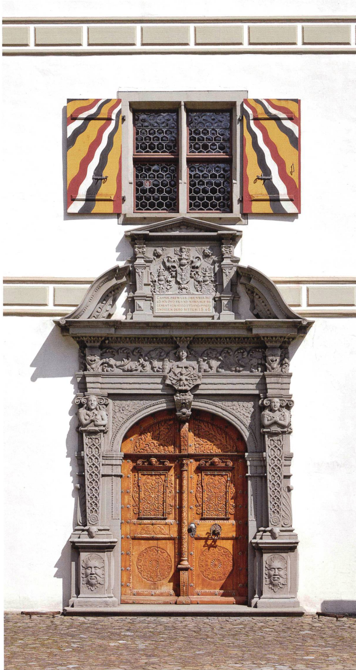
Portal des Freulerpalastes in Näfels (Im Dorf 19).

Als erster der auf drei Bände angelegten Glarner Reihe der «Kunstdenkmäler der Schweiz» erscheint das Buch zu den acht Dörfern des Glarner Unterlands; seit 2011 bilden diese die Gemeinde Glarus Nord. Dieses Gebiet war bereits in römischer Zeit eine Durchgangszone zu den Bündner Alpenpässen, wovon unter anderen das Kleinkastell in Filzbach-Vordemwald zeugt. Im Glarner Unterland, das eine frühe Sonderentwicklung eines bäuerlichen Alpentaales hin zum «Industriestaat» prägt, hat sich die ursprüngliche Bebauung weitgehend erhalten.