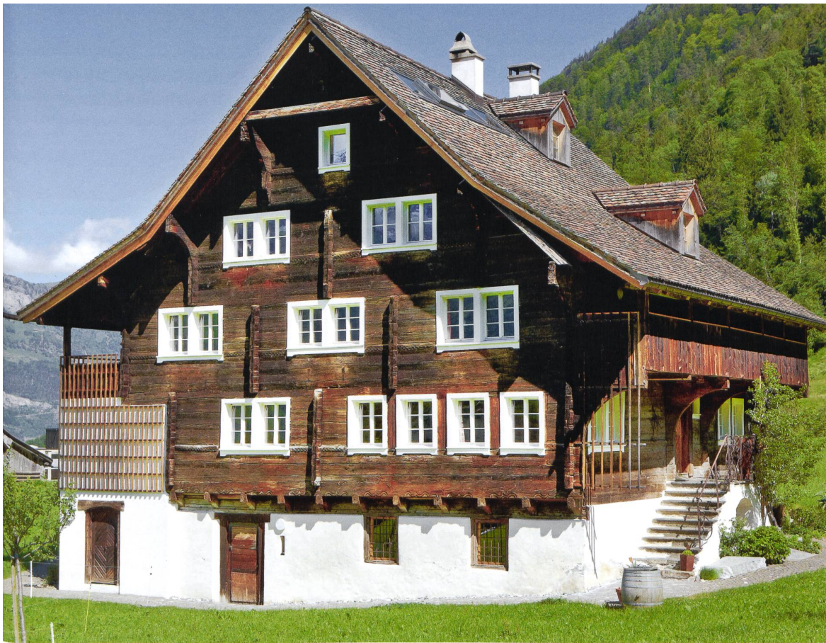
Balmermatte, Hofstatt Hartolfingen in Bürglen, 1632. Das Haus gehört zu den wenigen Bauten mit vorkragendem Blockbau. Der eingetute Auflagerbalken auf der Giebelseite ruht auf Rosskopfkonsolen und ist mit gestaffelten Kielbögen verziert. Die Schauseite ist reich gestaltet: Die Sohlbänke sind als Würfelfriese gearbeitet. 2012

und die Riedertalkapelle in Bürglen sowie die Erstfelder Jagdmattkapelle. Auch die Urner Loretokapelle steht im Schächental. Im ausgehenden 16. und frühen 17. Jahrhundert entstanden zahlreiche neue Kapellen, die einen Modernisierungsschub im Kirchenbau einleiteten. Die Pfarrkirchen von Unterschächen, Schattdorf, Attinghausen und Bürglen wurden wenig später ebenfalls neu errichtet, letztere als aussergewöhnlicher Kuppelbau. Die Ausstattung der Sakralbauten mit Kunstwerken und liturgischem Gerät ist ausserordentlich reich, den Höhepunkt bildet ein Altarblatt des Flamen Dionisio Calvaert in der Spiringer Getschwilerkapelle. Der Kirchenschatz umfasst Arbeiten nahezu aller wichtigen Urner Goldschmiede, ausserdem einige auswärtige Kostbarkeiten, wie etwa einen Kastenschrein des Zuger Meisters Niklaus Wickart. Die erste protestantische Gemeinde Uris bildete sich in Erstfeld. 1899 konnte ein eigener neugotischer Sakralbau eingeweiht werden.