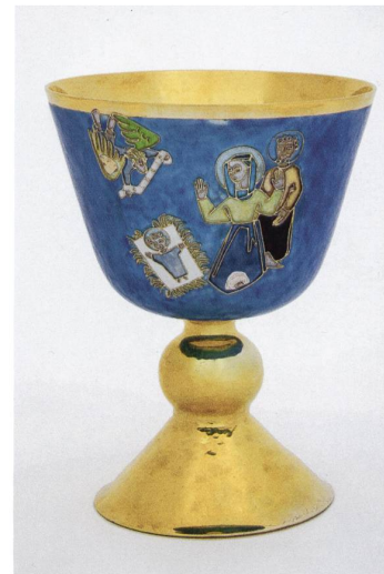
Messkelch der Marienkirche von Meinrad Burch-Korrodi, 1951. Die emaillierte Wandung der Kupa zeigt eine figürliche Darstellung der Geburt Christi mit Maria, Josef und Engel vor einem wolkgig blauen Grund.

Zur Inventarisierung der Sakralbauten und ihrer Altäre, Gemälde, Skulpturen, Glocken, Glasmalereien, liturgischen Gerätschaften, Paramente und Möbel gehörte ebenso die Erfassung und Analyse der verschiedenen Einzelobjekte, wie die Auswertung der zugehörigen Pläne, historischen Fotos, Schriftquellen aus dem Staatsarchiv und den Archiven der Klöster und Kirchgemeinden sowie der Sekundärliteratur. Wichtige Bild-, Plan- und Objektbestände befinden sich zudem in den städtischen Sammlungen des Historischen Museums Blumenstein und im Kunstmuseum Solothurn. Neueste Erkenntnisse aus jüngst erfolgten Restaurierungen konnten ebenso in die Arbeiten einfließen, wie ältere, punktuelle Inventarisationsarbeiten gebündelt, vervollständigt und massgeblich ergänzt werden konnten. Im Besonderen wurden die Glasmalereien und Glocken umfassend inventarisiert. Historiker und Textilfachleute trugen ebenfalls ihre Fachkenntnisse bei. Diese Inventare bieten erstmals einen umfassenden Überblick des reichen Bestandes sakraler Ausstattungen in Solothurn. Durch die integrale Betrachtung der Bauwerke wird so ein wichtiger Beitrag zur schweizerischen Kunstgeschichte geleistet.