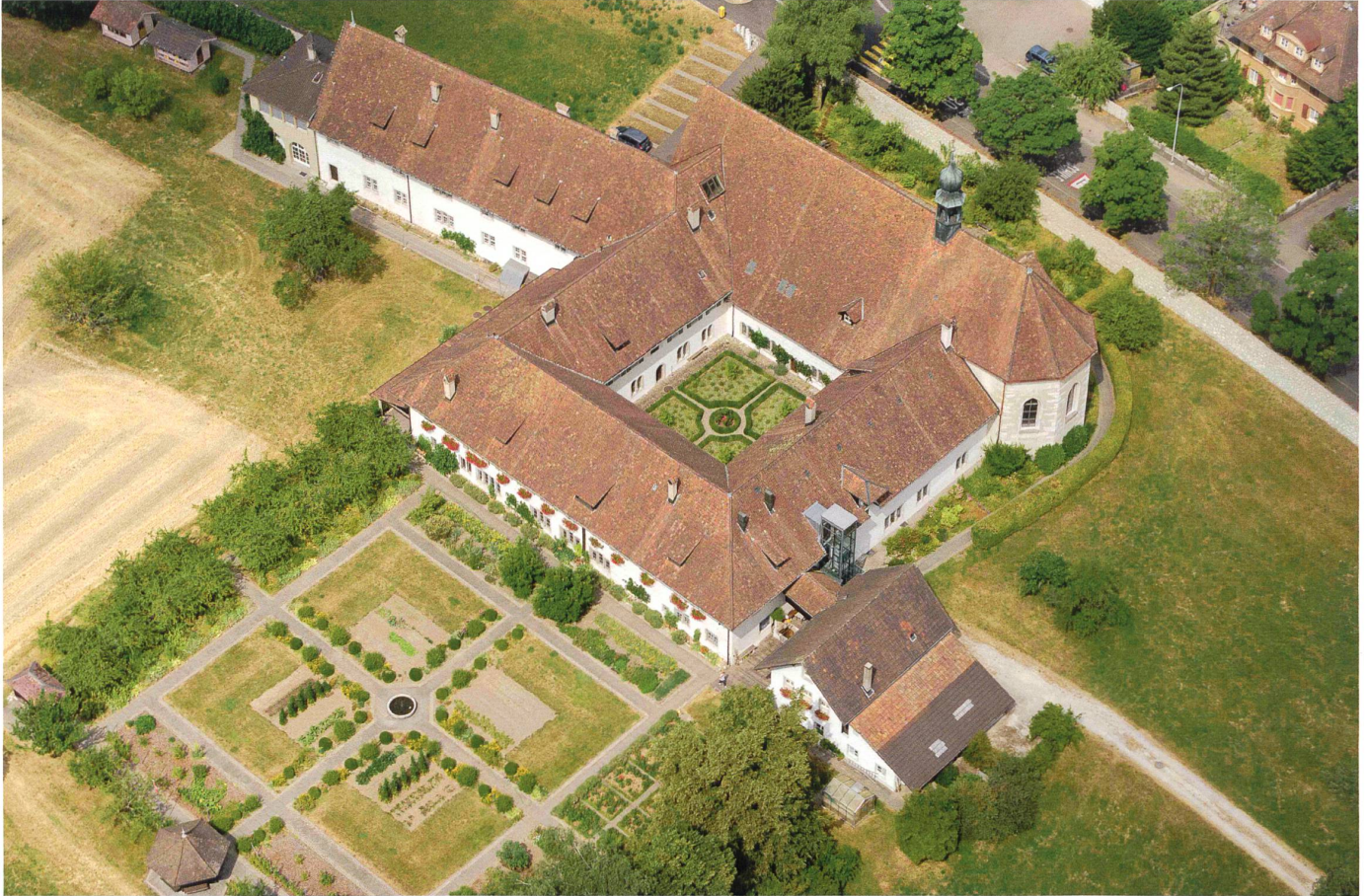
Die Klosteranlage Namen Jesu , Flugaufnahme von Südosten.

Mit dem dritten und letzten Kunstdenkmälerband zur Stadt Solothurn wird eine Lücke in der schweizerischen Kunsttopographie geschlossen: Ausgehend von der sakralen Bautätigkeit und den kunsthandwerklichen Fertigkeiten im mittelalterlichen Solothurn bis in die Mitte des 20. Jahrhunderts liefert er einen eindrucklichen kulturgeschichtlichen Beitrag.