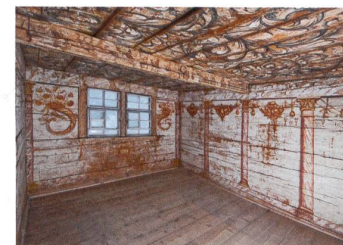
Ost- und Südwand der Dachkammer im «Höfli» in Obstalden (Dorf 8). Gemalte Säulen tragen einen marmorierten Architrav, der mit dem obersten, leicht vorkragenden Balken der Bohlenwände zusammenfällt. Malerei aus der Bauzeit um 1700. Foto Urs Heer, 2010