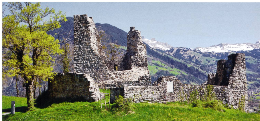
Burgruine in Attinghausen. Teile der Mauer- substanz des Turms wurden 1897 rekonstruiert, 1979 und 2011/12 gesichert. Die Burgruine diente über Jahrhunderte als Steinbruch und hat dabei ihre monumentale Dimension eingebüsst.

Der Band ist abschliessend um ein 50 Seiten umfassendes Kapitel «Hoheitszeichen» ergänzt. Ausführlich dargestellt sind unter anderem Wappen, Siegel, Zahlungsmittel und Militaria. Hier verfügt der Kanton Uri mit fünf mittelalterlichen Schlachtenbannern und einem Harsthorn aus der Zeit um 1520 über aussergewöhnliche Zeugnisse der historischen Kriegführung. Die Standesikonographie bietet mit zahlreichen Standesscheiben aus dem 16. und 17. Jahrhundert Höhepunkte der Glasmalerei.