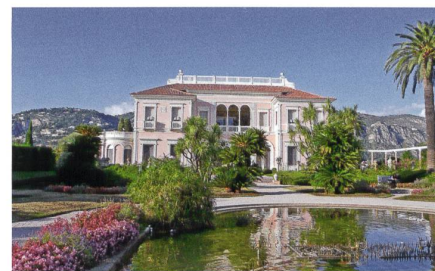
Villa Ephrussi de Rothschild