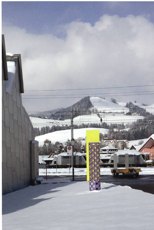
Kunstmuseum Appenzell 2015 mit der Plastik «Pliage C 54» (1999) von Gottfried Honegger.

Die (über-)regionale Resonanz, von der eine Institution letztlich lebt, will erarbeitet werden – dabei geht es aber nicht um die Anerkennung der Institution selbst, sondern um die Herstellung einer breiten Akzeptanz gegenüber der Tatsache, dass die Kultur der von Aufklärung und Innovation geprägten Moderne Teil der individuellen, aber auch der gesellschaftlichen Identität ist. Kunst ist eine der sichtbaren Spitzen dieses Eisbergs, dieser Kulturgeschichte – und deswegen sollte ein Kunstmuseum immer wieder versuchen, die Konturen des Eisbergs zu skizzieren. Insofern machen Kunstmuseen in Randgebieten,