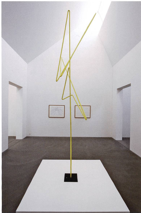
Ausstellung «Norbert Kricke» im Kunstmuseum Appenzell 2012. Im Vordergrund die Plastik «Raumplastik Gelb – Tempel» (1952).