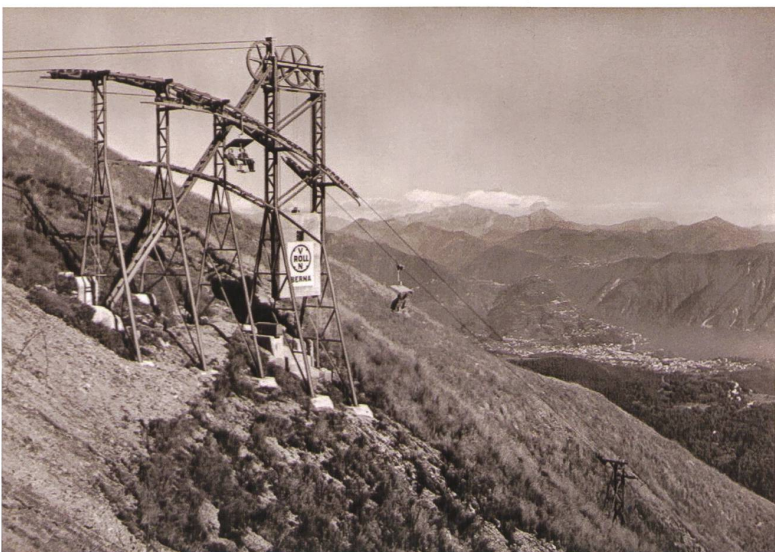
Abb. 13 Monte Lema TI. Die Sesselbahn mit kuppelbaren Zweiersesseln quer zur Fahrtrichtung von Miglieglia zum Monte Lema war von 1952 bis 1998 in Betrieb (Sammlung des Autors)

nen der Natur und der Witterung. Die bauliche Analogie dieser Archetypen zu den frühen Unterkünften alpiner Hirten ist auch hier auffallend. Die einfachen Steinbauten, erstellt mit Baumaterialien aus der näheren Umgebung, hatten meist nur eine kurze Lebensdauer, bis zur Jahrhundertwende wurden sie mehrheitlich durch grössere und komfortablere Neubauten ersetzt.