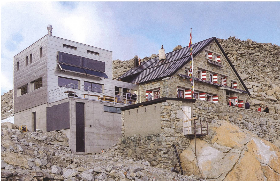
Cabane de Trient , par leur architecture très différente chaque volume exprime les paradigmes de son époque.

grands dortoirs, toilettes extérieures et réfectoire muni d'une cuisine sommaire – s'est avérée salvatrice pour fidéliser une clientèle devenue plus exigeante. La norme tend désormais à la réalisation de chambres insonorisées de quatre à huit personnes, de sanitaires avec WC et douches alimentées en eau chaude et d'une cuisine professionnelle capable d'offrir un service en demi-pension.