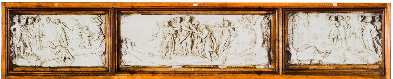
Abb. 8 St. Ursen, Bozzetto des mittleren Fassadenreliefs mit der Schlüsselübergabe an Petrus. Links oben ist der Übertragungsraster zu sehen, unten die Abstandhalter (Gipsbatzen). Die kompakte Figurengruppe ist in Hochrelief ausgebildet und steht – wie beim ausgeführten Relief – vor weiter Landschaft mit Stadtansicht (links) und Bergen (oben). Diese sind in feinem Flachrelief dargesellt, was sie perspektivisch zurücktreten lässt (HMSo 1989a-c. Foto Jürg Stauffer, Langenthal, 2014. KDSO)