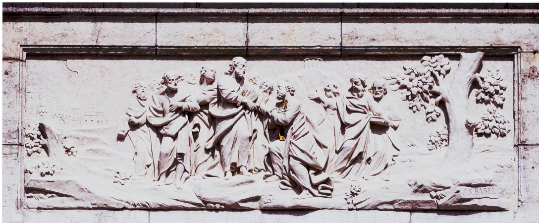
Abb. 10 St. Ursen, Westfassade, Relief über dem Hauptportal mit der Schlüsselübergabe an Petrus, von Johann Baptist Babel, 1775

des Stadtheiligen Urs, in der Mitte die Schlüsselübergabe an Petrus und rechts die Verweigerung des Götzendienstes von Urs und Viktor dar.