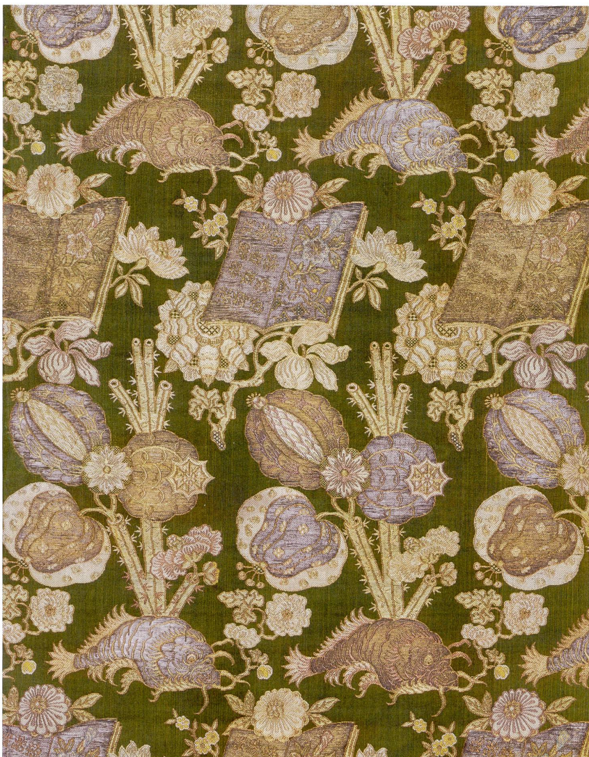
Abb. 3 Seidengewebe mit Karpfen und Büchern, Niederlande, Amsterdam, um 1735–1745. Riggisberg, Abegg-Stiftung, Inv. Nr. 865, Ausschnitt.