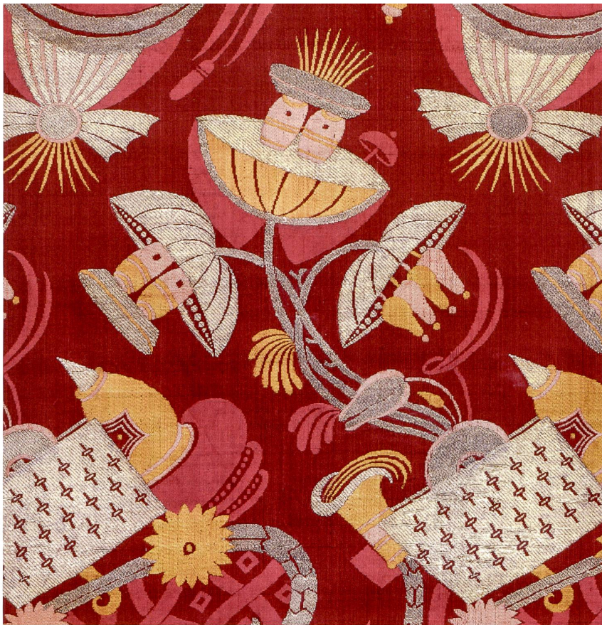
Abb. 2 Seidengewebe mit exotischen Motiven, Frankreich oder Italien, um 1700–1710. Riggisberg, Abegg-Stiftung, Inv. Nr. 255, Detail.