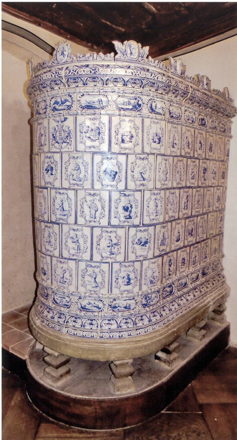
Fig. 16 Poêle à carreaux blancs et motifs bleus, daté 1742. Hôtel de ville du Landeron (NE). OPAN, 2018

Ces chinoiseries témoignent en effet de la fascination qu’exerce la Chine au début du XVIII e siècle. Souvent dépeinte comme un pays de cocagne, cette contrée éloignée semble alors regorger de richesses que l’Europe entière convoite – porcelaine, thé, soieries, laque, épices... Cette vision fantasmée permet des jeux de mise en abîme qui ravissent la société des Lumières, notamment pour les possibilités qu’elle offre de contourner la censure et d’interroger les codes sociaux. Sous prétexte d’arts décoratifs et de raffinement