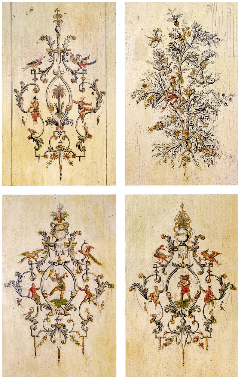
Fig. 7 Médaillon au palmier (10). Photo Dirk Weiss, 2018