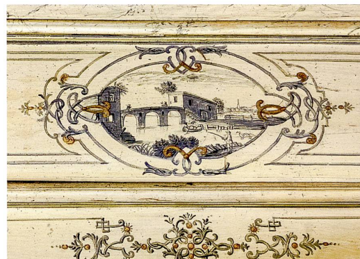
Fig. 11 « Le vendangeur » (9).

fleurs et oiseaux dissimulés parmi les créatures imaginaires rappellent aussi les productions de style naturaliste de cette manufacture. Le motif de tertre herbeux sur lequel se tiennent les Chinois caractérise également un style de décors sur faïence ou porcelaine appelé Inselstil . De leur côté, les médaillons à motifs d'entrelacs et d'arabesques mêlés de lambrequins, dans lesquels évoluent les figures secondaires sont davantage dans le goût des grotesques de l'ornemaniste Jean Berain (1640-1711), diffusées au moyen d'estampes et copiées à Augsbourg ou Nuremberg 7 .