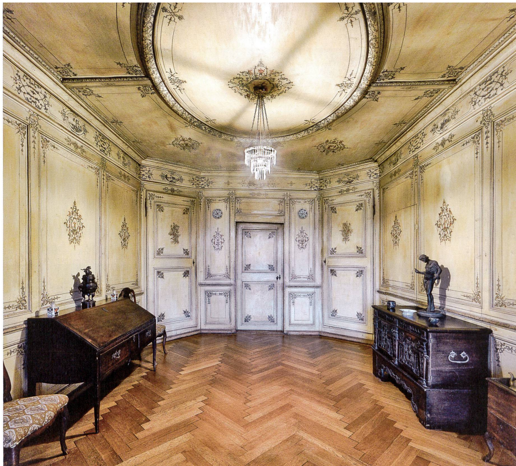
Fig. 4 Salon chinois, paroi ouest. Photo Dirk Weiss, 2018