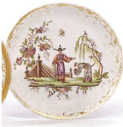
Fig. 13 «Le fumeur de pipe» (3), détail. Photo Dirk Weiss, 2018