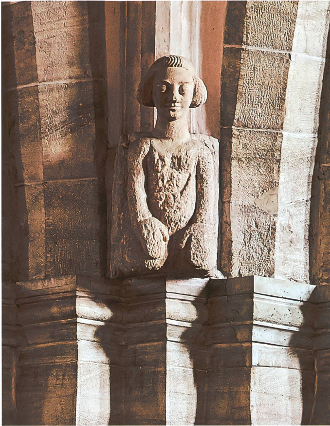
Abb. 6 Evangelistensymbol des Matthäus (Engel) am südwestlichen Vierungspfeiler. Die Skulptur wurde aus wiederverwendetem spätromanischem Torso und neu ergänztem Kopf zusammengefügt.

In den zwei Pflanzenkapitellen seitlich des Ritterkapitells am Chorpfeiler (c) sind Spolien zu vermuten, die mit gewisser Plausibilität nach dem Erdbeben hier ihren Platz fanden. Seitlich ans Ritterkapitell angrenzend, weichen sie in ihrer Materialität und der Aufstellung von den übrigen Kapitellen ab (vgl. Abb. 5). Der Schaftring mit Kapitellkörper und Abakus besteht nicht aus einem Werkstein, wie dies bei den übrigen Chorkapitellen anzutreffen ist. Zirka zwei Zentimeter des Kapitellfusses bestehen aus anderem Kalkstein als der darüber aufsetzende Kapitellkörper. Ein im Aufbau vergleichbares Pflanzenkapitell findet sich auf der nördlichen Langhausempore im zweiten Joch von Westen (Abb. 9). Der Abakus wurde abgeschlagen und der Schaftring aus einem anderen Stein gefertigt. Dieses Kapitell weist in der Verwendung von Kalkstein und in der Gestaltung der Akanthusblätter, die an verschiedenen Stellen à jour gearbeitet wurden, eine hohe stilistische Übereinstimmung mit einigen Pflanzenkapitellen an den Chorpfeilern auf. Vermutlich entstammen einige Kapitelle der Langhausempore und der Chorpfeiler demselben Bestand und wurden bei