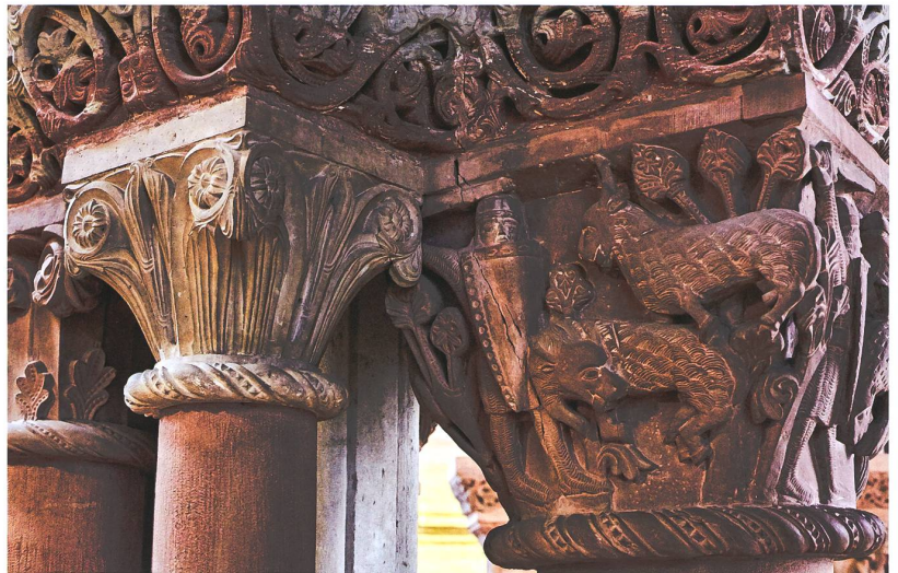
Abb. 5 Riss und Beschädigung am Figurenkapitell des Chorpfeilers (c) sowie seitliches Pflanzenkapitell bestehend aus unterschiedlich kalkhaltigem Stein. Foto Dirk Weiss, 2019

Mit dem Erdbeben 1356 und den daraus resultierenden Zerstörungen – besonders durch das Einstürzen des Chorgewölbes – wurde eine umfassende Sanierung notwendig. Unter Bischof Johannes Senn von Münsingen erfolgte der Neubau der Empore und des Obergadens, und auch in der Ostkrypta sind Sanierungsmaßnahmen zu verzeichnen. In dieser Phase des Wiederaufbaus wurden an verschiedenen Stellen im Münster Bauskulpturen wiederverwendet. Zwei Skulpturen der Evangelistensymbole, die am süd- und nordwestlichen Vierungspfeiler zu sehen sind,