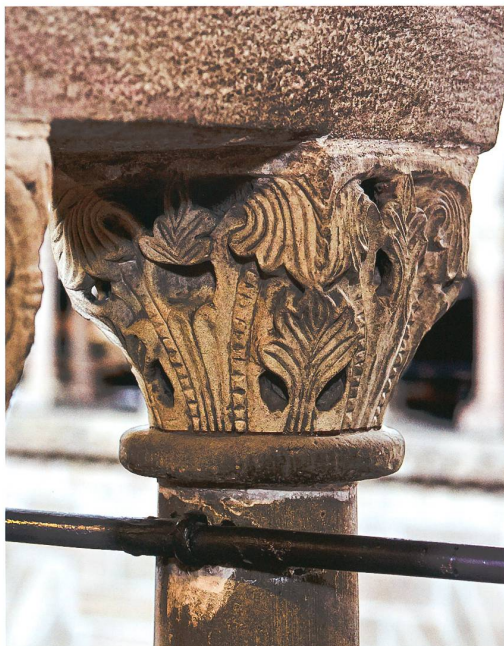
Abb. 9 Überarbeitetes Akanthuskapitell aus Kalkstein im zweiten Joch von Westen der nördlichen Langhausempore des Basler Münsters. Foto Dirk Weiss, 2019

Chorpfeilers (b) sind Ersetzungen zu vermuten (Abb. 10). Die ganzen Natursteine samt Rankenfries wurden neu hergestellt. Im Übergang zum nächstfolgenden Friesabschnitt zeigt sich deutlich, wie das Ornament unterbrochen ist.