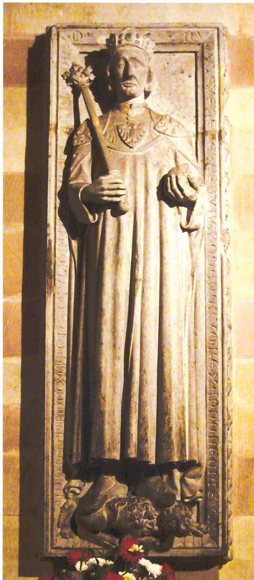
Abb. 7 Rudolf von Habsburg (†1291), Grabplatte von 1285/91 in der Krypta des Speyerer Doms. Die Grabplatte ist aufgrund formaler und stilistischer Übereinstimmungen denselben Bildhauern wie jenen des Hauptportals des Basler Münsters zuzuschreiben.

Ein weiterer Aspekt könnte die These, im ersten Habsburger Königspaar mögliche Auftraggeber des Hauptportals und die Beförderer des Kaiserpaarkultes im Basel des 13. Jahrhunderts zu sehen, bekräftigen: Rudolf von Habsburg berief sich nämlich zur Legitimierung seines Königtums auf seine Vorfahrin Kaiserin Kunigunde von Luxemburg, mit der er mütterlicherseits verwandt war und durch die er auch an die karolingische Dynastie anschloss. 14 Dass er auf ein heiliggesprochenes Kaiserpaar rekurrierte und mit dessen Standfiguren letztlich auch seine Herrschaftseignung kundtun wollte, erscheint plausibel. Beachtenswert ist auch, dass Kaiser Heinrich am Hauptportal mit Kirchenmodell dargestellt ist, dass er also um 1280 eindeutig als Förderer des Münsters bzw. der Kirche gesehen wurde. Falls nun Rudolf von Habsburg Initiator des Portalbaus