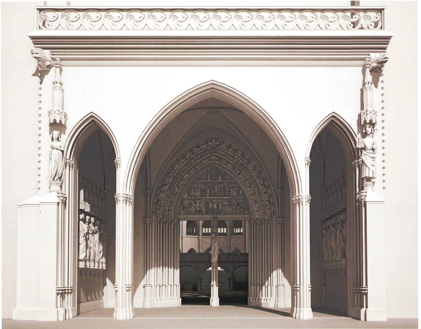
Abb. 2 Das gotische Hauptportal des Basler Münsters, um 1270/85, in einer Rekonstruktion von Marco Bernasconi und Serafin Pazdera, 2011.

1347 in Basel ein. So wurde erstmals im Münster wieder eine Weihnachtsmesse gefeiert, in Anwesenheit des Herrschers und des eben erhaltenen Heiliums. Ein weiterer Grund Bischof Senns für die Reliquienaneignung könnte die Absicht gewesen sein, sich als Wiederhersteller des Bistums Basel, als «Restaurator» vieler Klöster 5 in die Nachfolge des ottonischen Kaiserpaars zu stellen. Dass Kaiser Karl IV. (1316–1378), Urenkel Rudolfs von Habsburg und aus dem Hause Luxemburg wie die Kaiserin Kunigunde, die Kaiserpaarverehrung förderte, kann bisher nicht belegt werden. Nach dem Basler Erdbeben von 1356 kam er aber erneut nach Basel und dürfte den wiederaufgebauten Münsterchor sowie das wiederhergestellte Grabmal der Habsburger Stammutter besucht haben. 6