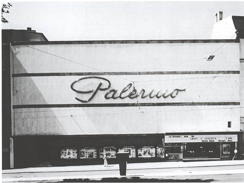
Abb.9a Kino Palermo, Theaterstrasse 4, Basel, Architekten: Suter + Burckhardt, Basel, um 1928. Foto Wolf. Quelle: Staatsarchiv Basel-Stadt, NEG 8018 (Fotoarchiv Wolf)