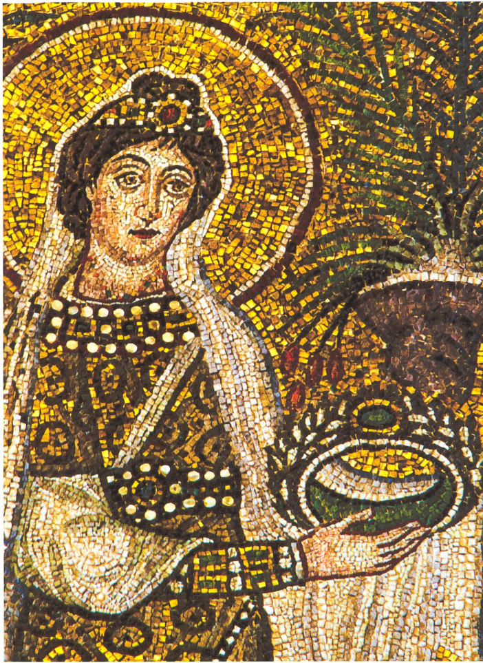
Fig. 8 Mosaïque de la basilique Saint-Apollinaire-le-Neuf à Ravenne. Détail de la procession des vierges. Tiré de P. Porta, in A. Carile (dir.), Dall'età bizantina all'età ottoniana, volume 2.1 , Venezia, 1991, XCVII-C, photo P. Zappaterra

supposée des perles de La Tour-de-Peilz, des analyses physico-chimiques ont été effectuées sur trois exemplaires retrouvés dans les sépultures T143, T170 et T481.