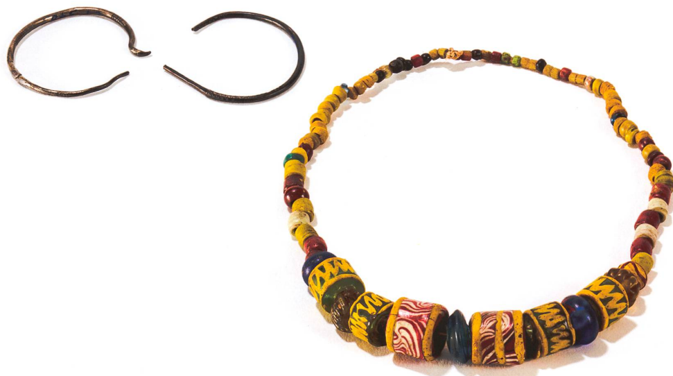
Fig. 1 Collier de perles en verre de la tombe 166B de Lausanne, Bel-Air (VD). Dernier tiers du VI e -premier tiers du VII e siècle.

L'une de ces quatre sépultures (T 137) a livré, près du crâne, des filaments d'or formant des replis, associés à un minuscule prisme en cristal de roche (fig. 3). À l'image d'autres découvertes faites dans les régions rhénanes et au nord de la Gaule, où des éléments de parure identiques ont été découverts dans la même position par rapport au squelette, mais en association avec des restes de tissus, les fils d'or de La Tour-de-Peilz ont pu être interprétés comme des ornements brodés sur un bandeau