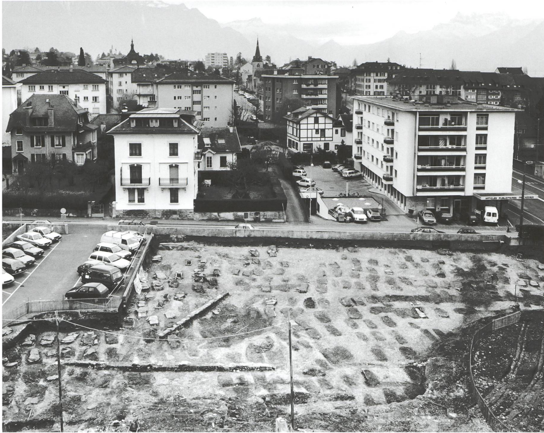
Fig.2 Vue générale du cimetière du Clos d'Aubonne à La Tour-de-Peilz (VD) lors des fouilles de 1988-1989, en direction de l'est.

ou un galon bordant un voile destiné à retenir la chevelure 1 . La coiffe de la reine mérovingienne Arégonde, morte en 580, dont la riche sépulture a été mise au jour dans la basilique Saint-Denis près de Paris, constitue un bel exemple de l'aspect que pouvait revêtir celle de La Tour-de-Peilz. La reine Arégonde portait un bandeau brodé de fils d'or qui enserrait ses cheveux recouverts d'un long voile de soie de couleur jaune et rouge (fig. 4) 2 .