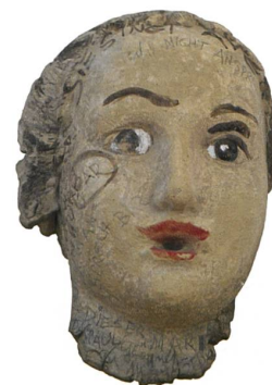
Annemarie von Matt, Die Nicht AnsprechBAR , 1940–1961. Ton, bemalt und beschriftet, Nidwaldner Museum, Stans.

Weitere Informationen: www.nidwaldner-museum.ch