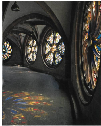
Farbiges Lichtspiel im Chorumgang der Empore.