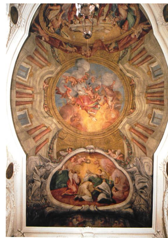
Katholische Pfarrkirche St. Nikolaus in Herznach. Chorgewölbe mit dem Francesco Antonio Giorgioli zugeschriebenen Deckengemälde. Foto Christine Seiler, 2015. DPAG

Betrachten Sie hier die eindruckliche Barockkirche St. Nikolaus in Herznach.