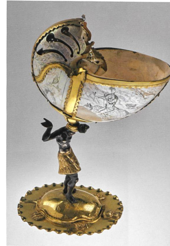
Frank Christian, Nautiluspokal, um 1680 , Ville de Genève, Musées d'art et d'histoire, Schenkung Anne-Catherine Trembley an die Bibliothèque publique de Genève, 1730, G 0937.

Mehr Informationen zum Projekt und zur Ausstellung unter www.theexotic.ch