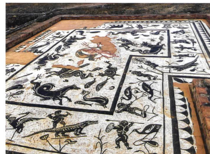
Römisches Mosaik in Itálica.