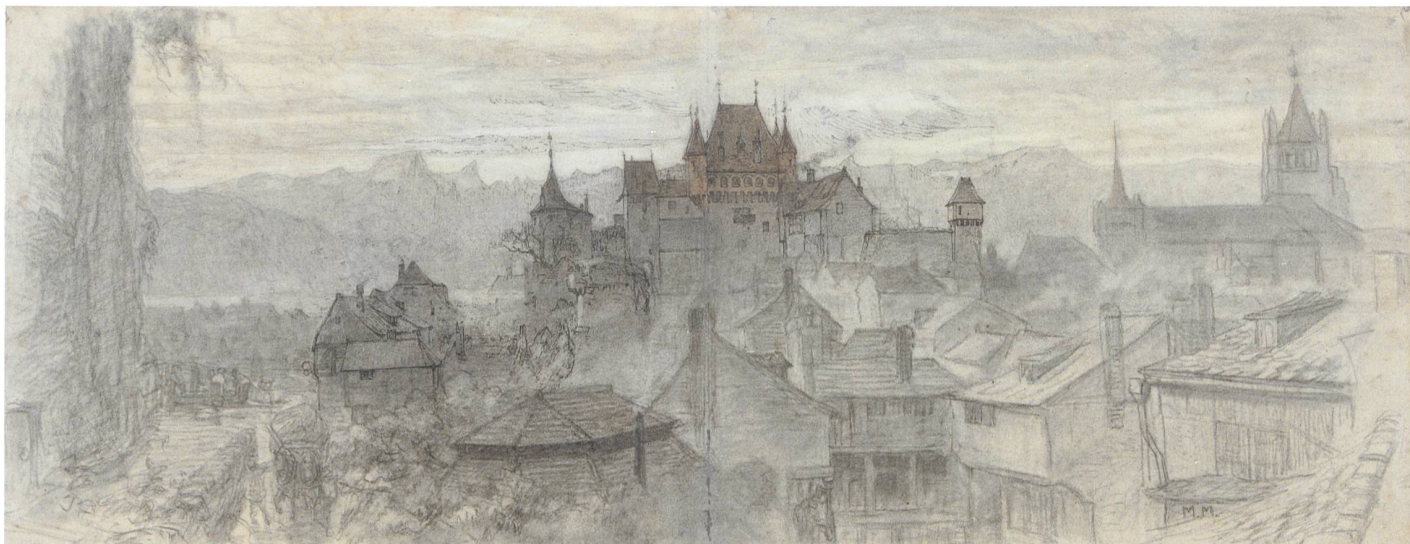
Fig.5 Matthijs Maris, Vue de Lausanne, 1861-1862, charbon, plume et encre noire, pinceau et encre rouge, 25,5×66 cm, Amsterdam, Rijksmuseum, inv. SK-A-3275.

qui en ont. Les plus agréables qualités de la peinture sont la netteté, la propreté et l'uni.» 8 Il arrive d'ailleurs à Liotard de rendre explicitement hommage à ces peintres, comme dans sa Jeune femme buvant du chocolat (fig. 4), où il cite une Vue de l'Oude Kerk de Delft par Hendrick Cornelisz. van Vliet 9 .