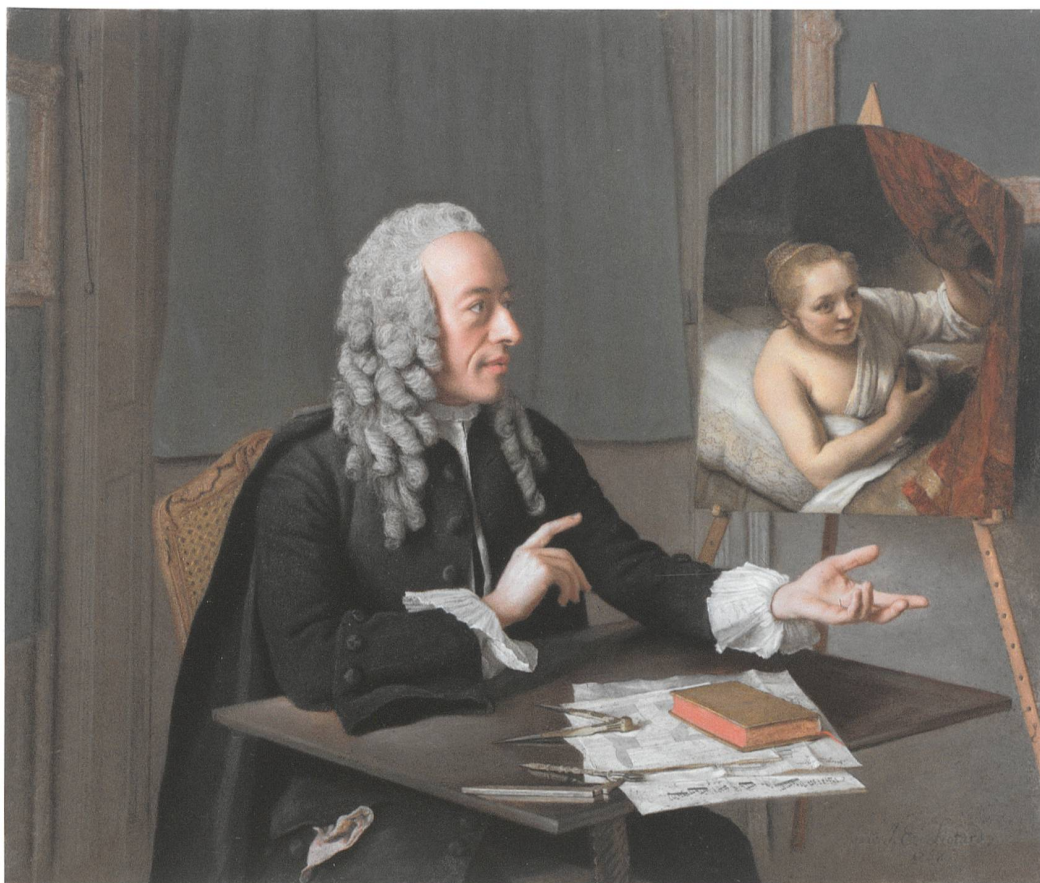
Fig. 3 Jean-Étienne Liotard, François Tronchin , 1757, pastel sur parchemin, 38×46,3 cm, Cleveland Museum of Art, inv. John L. Severance Fund 1978.54.