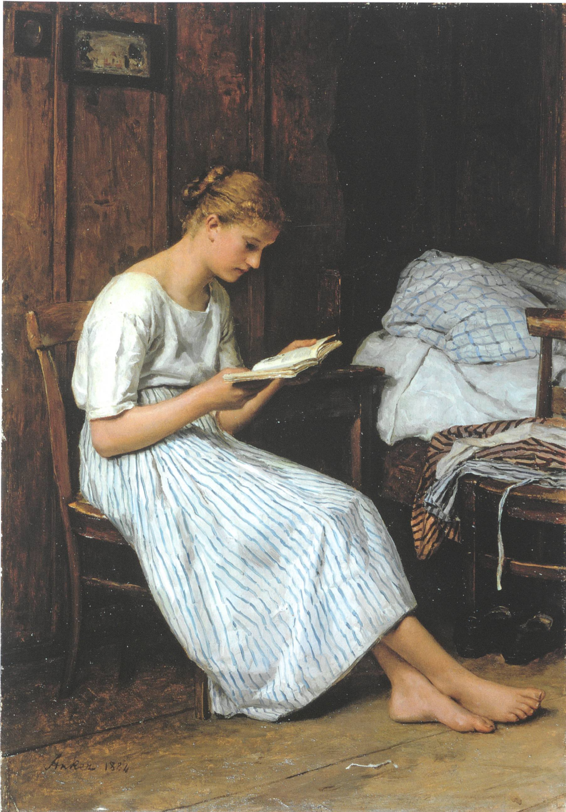
Fig. 6 Albert Anker, Une lectrice de Gotthelf , 1884, huile sur toile, 59×42 cm, collection privée.