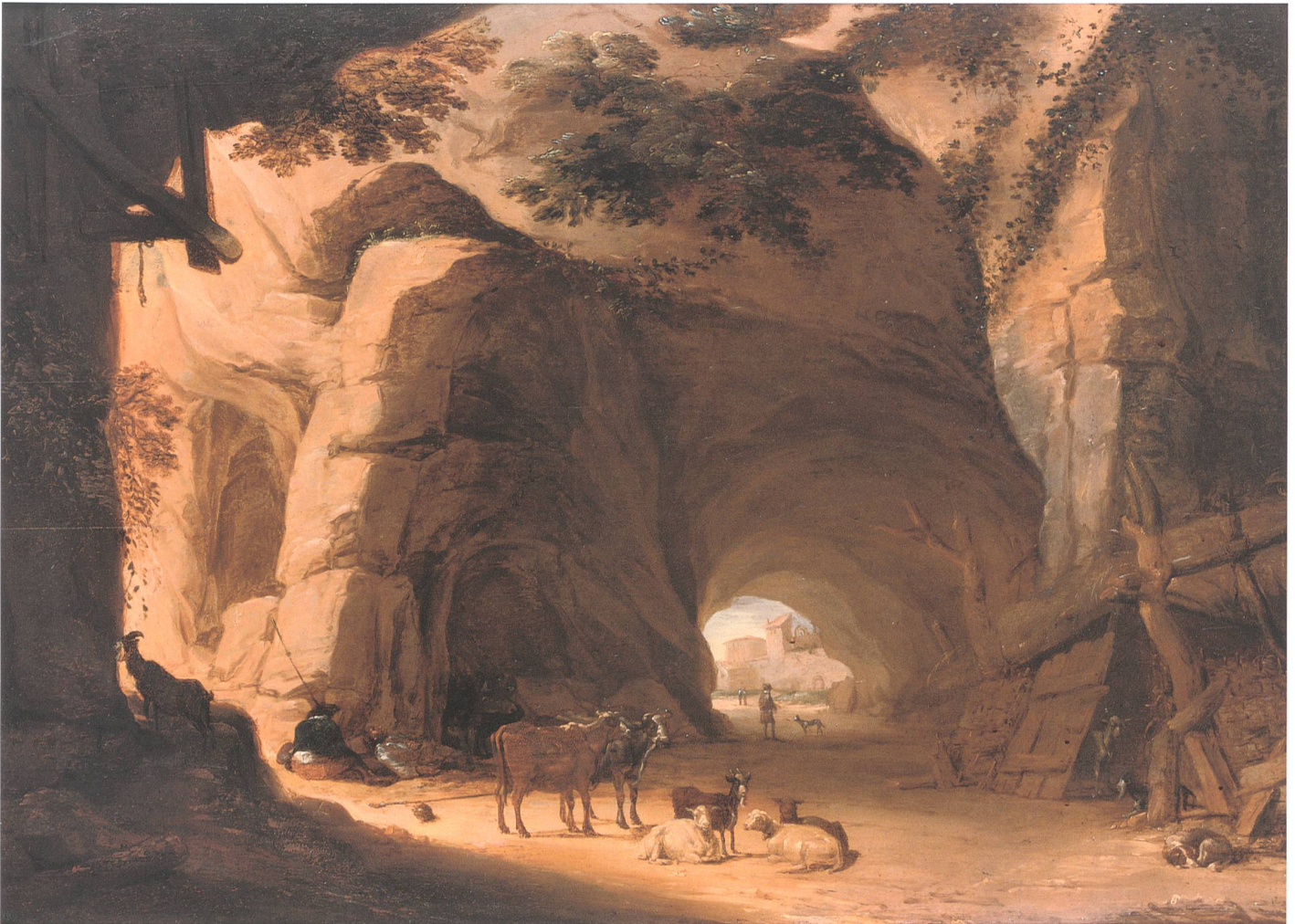
Abb. 4 Lambert Doomer. Hirten und ihre Herde ruhen vor einer Grotte, Öl auf Leinwand, 60,3 × 83,5 cm, Privatsammlung.

Zeit war es durchaus üblich, dass sich die niederländischen Maler von Skizzen inspirieren liessen, die von anderen Meistern vor Ort erstellt worden waren. In diesem Zusammenhang ist Lambert Doomer zu erwähnen, der Gebirgslandschaften von Hackaert oder Savery (Abb. 3) wiedergab, gefolgt von Schellinks und Pieter de Molijn, während Herman Saftleven und Jacob van der Ulft Werke von Savery und van der Vinne 8 kopierten.