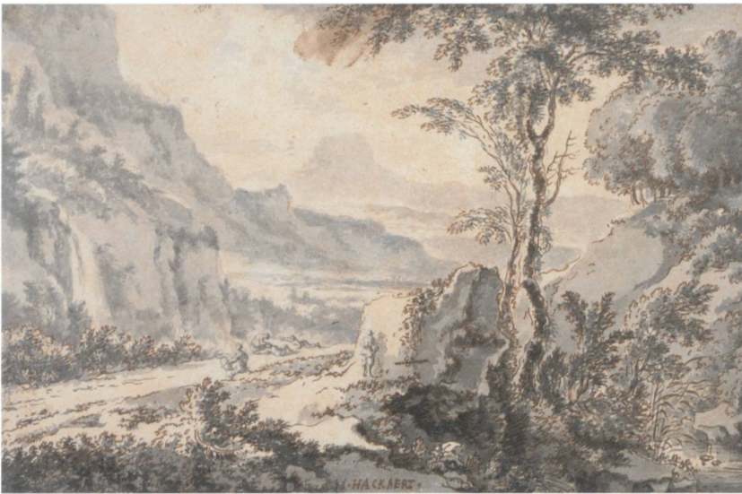
Abb. 7 Jan Hackaert. Blick von Nordosten auf die Stadt Glarus , um 1655, Feder, Tinte, Braun und Grau auf schwarzer Kreide, braun, grau und blaugrau laviert, 65,5 × 171,5 cm. In: Atlas Blaeu-Van der Hem , Wien, Österreichische Nationalbibliothek, Bd. 13:40, fol. 86.