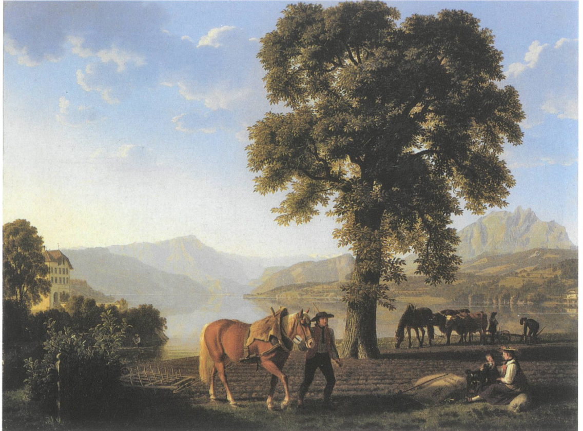
Abb. 11 Johann Jakob Biedermann. Bauer mit Pflug am Vierwaldstättersee , 1813, Öl auf Leinwand, 73,5×97 cm, Privatsammlung.

europäischen Raum als auch in ästhetischen Bewegungen wie dem Pittoresken und dem Erhabenen in England oder dem Sturm und Drang in Deutschland ein. Vermehrte Forschung zu diesem Phänomen der Verbreitung und die Untersuchung der im 17. Jahrhundert entstandenen Prozesse und Abläufe sollten in Zukunft dazu beitragen, neue Perspektiven in Bezug auf die Rolle der Schweiz beim Entstehen einer gemeinsamen europäischen Bildkultur zu eröffnen. ●