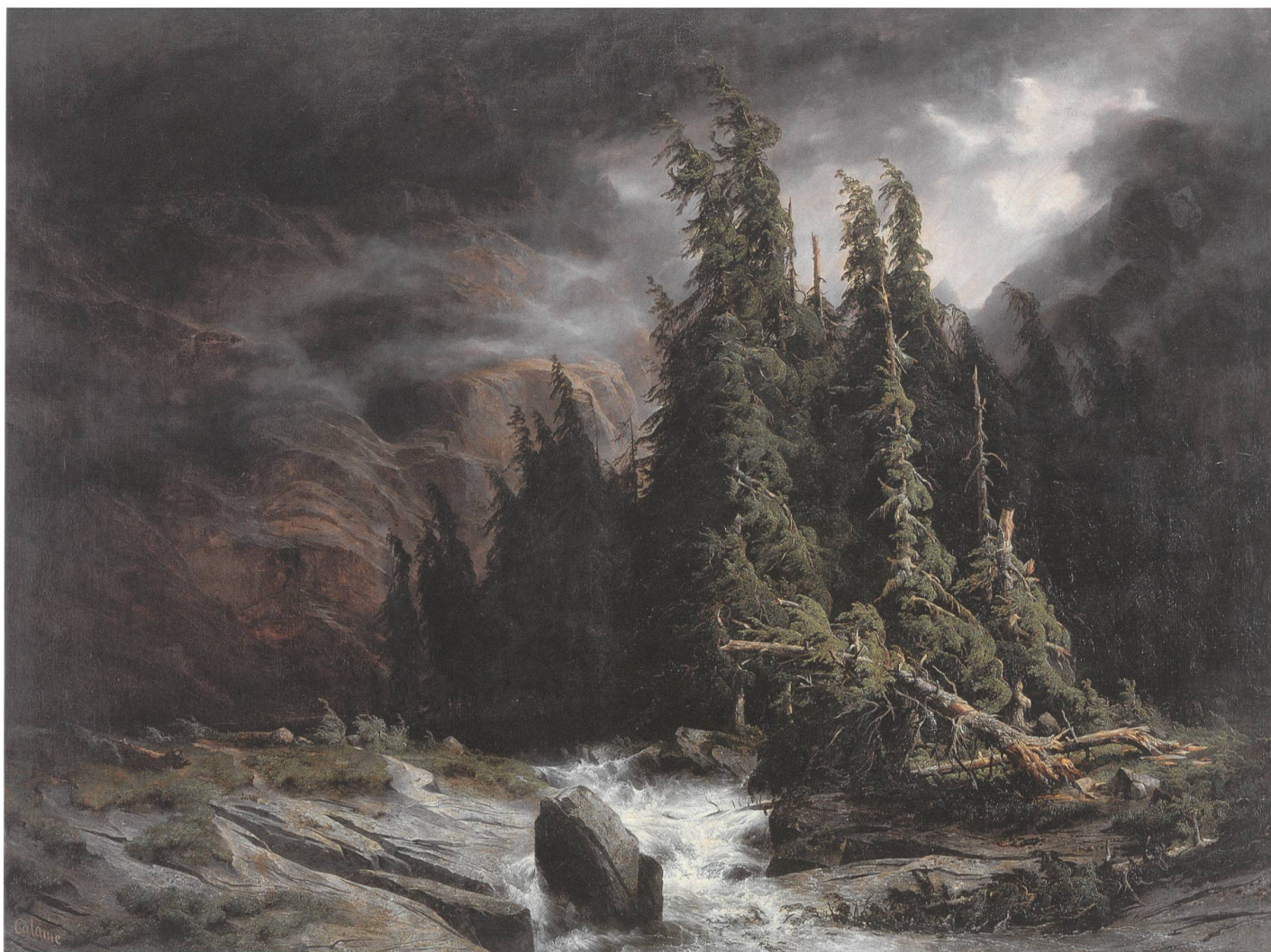
Fig. 6 Alexandre Calame, Orage à la Handeck, 1839, huile sur toile, 190 × 260 cm, Genève, Musée d'art et d'histoire, inv. 1839-0001.

pas à dire que je crois faire mieux [que les paysages de Ruisdael et Hobbema], non ! mille fois non ! mais il me semble que l'on peut aller plus loin, que ce n'est pas le dernier mot du paysage, ou si l'on aime mieux, le nom de Ruisdael n'est point pour moi les colonnes d'Hercule. » Calame peint en effet peu après ce voyage son tableau le plus connu, l'Orage à la Handeck (fig. 6), qui puise directement à la peinture de Ruisdael, dans lequel il développe un sentiment romantique qui fait défaut à l'art de son illustre prédécesseur.