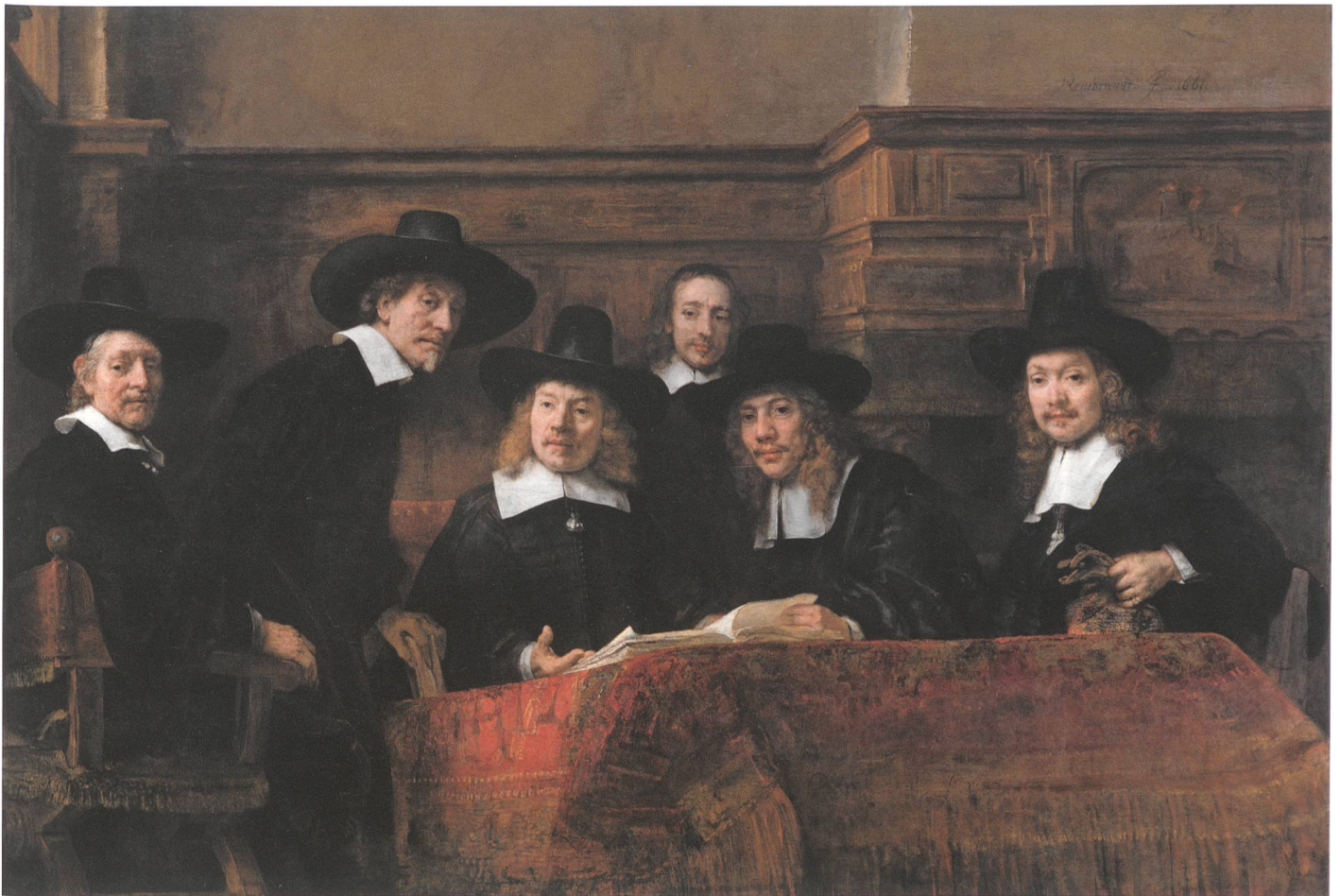
Fig. 10 Rembrandt van Rijn, Le syndic de la Guilde des drapiers , dit aussi Les Syndics , 1662, huile sur toile, 279×191,5 cm, Amsterdam, Rijksmuseum, inv. SK-C-6.