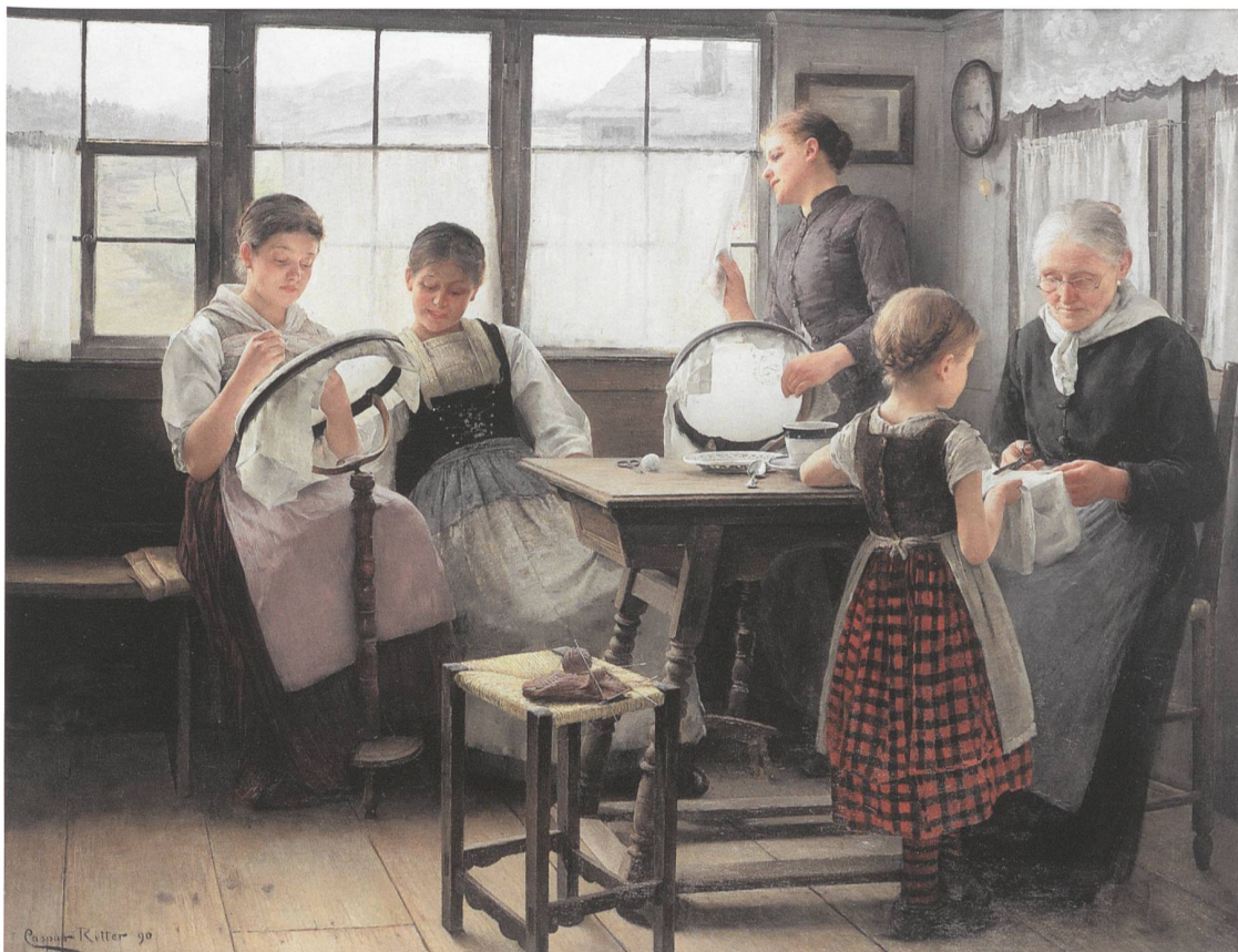
Fig. 7 Caspar Ritter, Brodeuses appenzelloises , 1890, huile sur toile, 140×184 cm, Kunst Museum Winterthur, inv. 292.