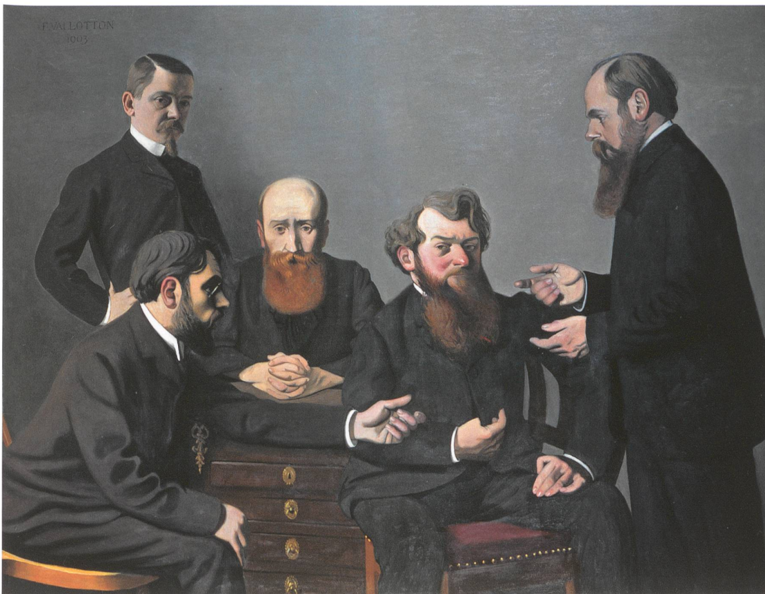
Fig. 11 Félix Vallotton, Les Cinq peintres, 1902-1903, huile sur toile, 145×187 cm, Kunst Museum Winterthur, inv. 749.