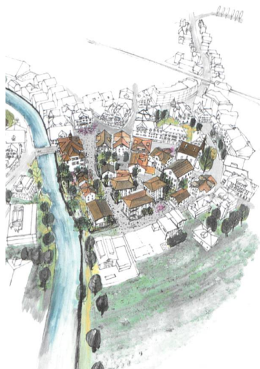
Projekt Zentrumsüberbauung Sarnen 2017. © Salewski & Kretz Architekten GmbH, Zürich

Nun steht es fest. Die Europäischen Tage des Denkmals vom 12. und 13. September 2020 finden statt. Die diesjährigen Denkmaltage laden unter dem Patronat von Bundesrat Alain Berset zur Debatte über «Weiterbauen – Verticalité – Costruire nel costruito – Construir en il costruì» ein.