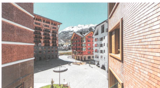
Tourismusresort Andermatt Reuss.