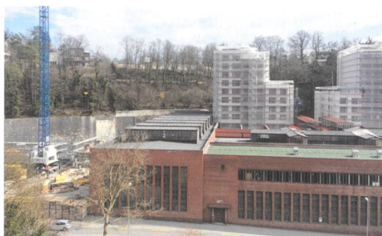
Stahlgießerei 2020.

10 Mio. Menschen werden gemäss Schätzungen 2045 in der Schweiz leben. Alle diese Menschen wollen wohnen, arbeiten und sich erholen. Ihr Bedürfnis nach Wohnfläche und Mobilität steigt kontinuierlich. Gleichzeitig soll dem Siedlungswachstum Einhalt geboten werden. Immer noch werden jeden Tag acht Fussballfelder verbaut. Statt «Bauen auf der grünen Wiese» lauten die Zauberworte: Siedlungsentwicklung nach innen und vertikale Verdichtung. Damit sich die Menschen in einem verdichteten Umfeld wohl fühlen, muss mit hoher Qualität weitergebaut werden. Dazu gehört auch der verantwortungsbewusste Umgang mit dem baukulturellen Erbe.