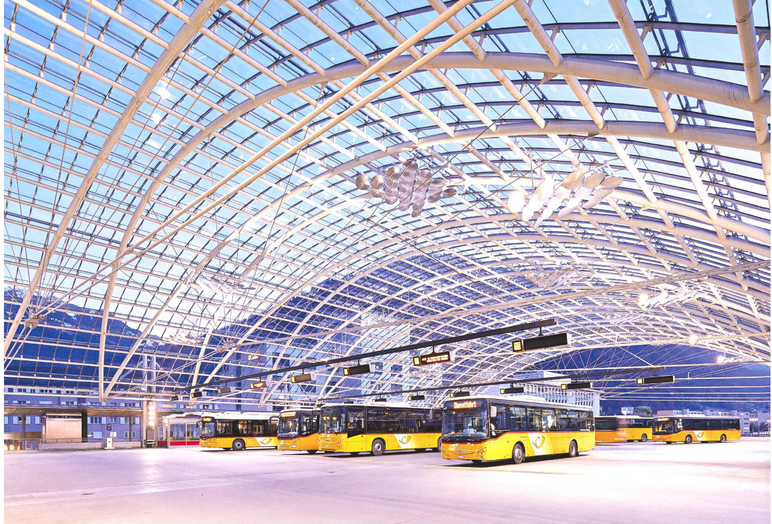
Postautostation und Betriebsgebäude PTT beim Bahnhof Chur, 1990–1995 , grosszügige Halle für den öffentlichen Verkehr.

trapunkt zur rasterartigen Fassade. Vier riesige Wandteppiche von Hans Erni zu den PTT-Themen Brief , Luftpost , Satelliten und Monteure empfangen jahrzehntelang die Besuchenden in der weitläufigen Eingangshalle.