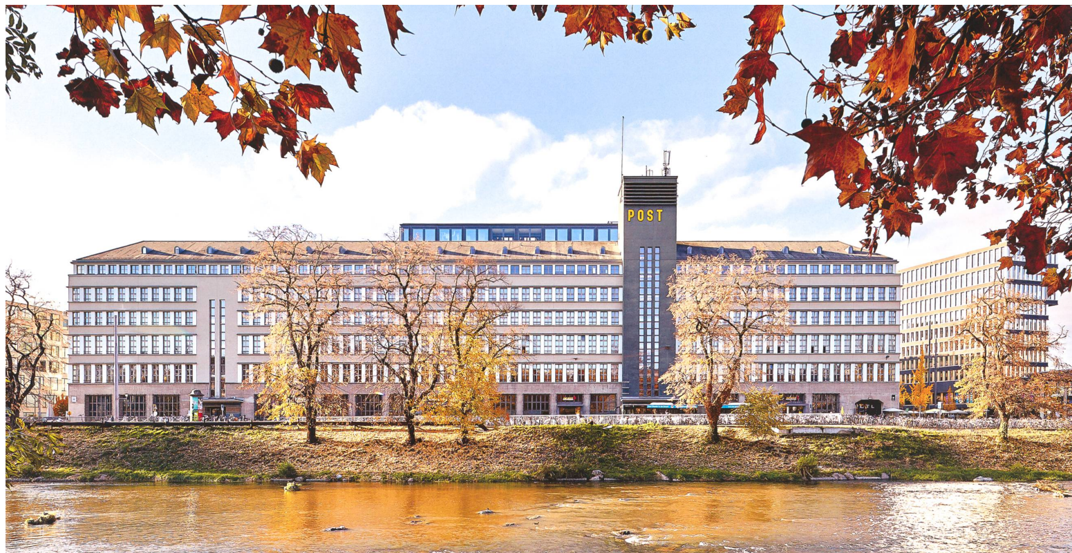
Die Sihlpost nach dem Umbau von 2014/15 mit farblich hervorgehobenem Uhrturm, im Hintergrund Gebäude der Überbauung Europaallee.

Dieser älteren Tradition verpflichtet sind die zehn 1892 für die Hauptpost Genf geschaffenen Kolossalstatuen. Die Werke personifizieren die Völker der Welt und stehen für den weltumspannenden Postverkehr mit seinem völkerverbindenden Charakter. Fünf verschiedene Künstler schaffen die Statuen: Auguste de Niederhäusern (Rodo) für die Völker Nordamerikas und Asiens, Jules Salmson für Europa und Indien, Charles Iguel für Malaysia und Ägypten, Maurice Reymond für Südamerika und Ozeanien sowie Cristoforo Vicari für Arabien und Afrika.