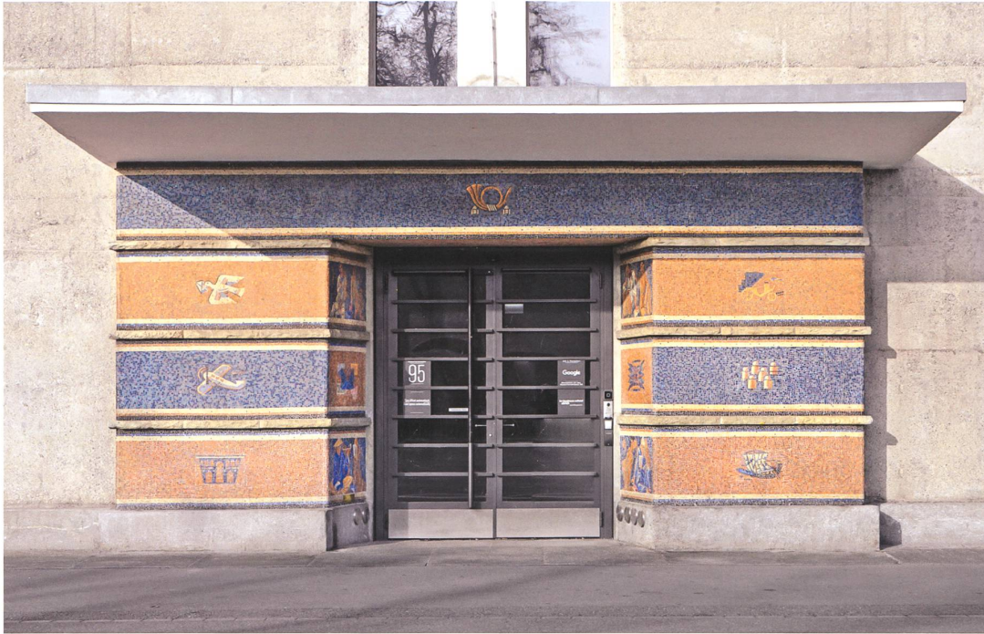
Mosaik am Eingang zur Sihlpost Zürich von Carl Roesch, 1929.

geführt werden. Die Mosaik­e stam­men von Carl Roesch und zeigen Post- und TT-betriebliche Sujets sowie Menschen, die Briefe empfangen haben.