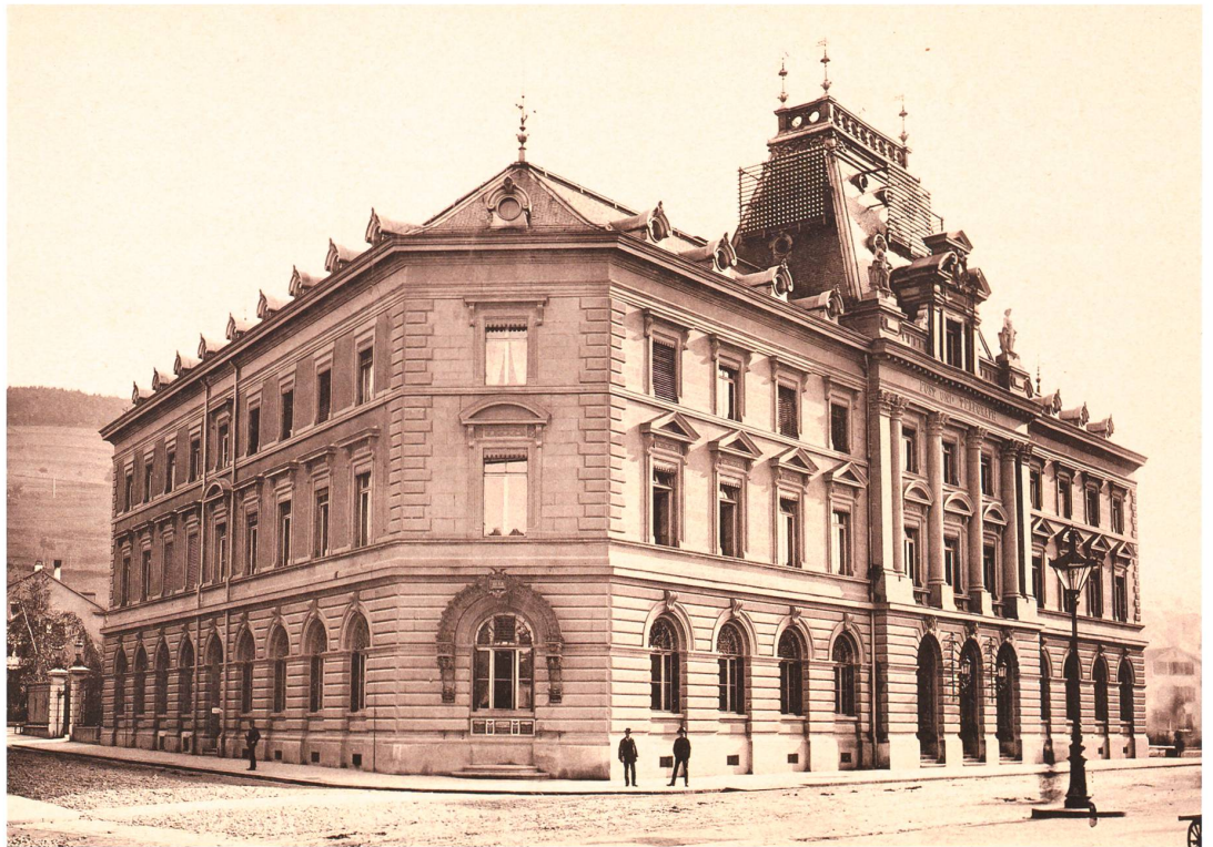
Hauptpost St. Gallen, 1887, erstes vom Bund in eigener Regie gebautes Postgebäude der Schweiz. Lichtdruck Brunner & Hauser, Zürich, Museum für Kommunikation, Bern (MfK) [FFF 01655]

Die vor den 1850er Jahren und damit vor dem Eisenbahnzeitalter erbauten Postgebäude in grösseren Orten sind bald verkehrstechnisch ungünstig gelegen und angesichts des stark zunehmenden Verkehrs zu klein. Die eidgenössische Postverwaltung fasst den Bau bundeseigener Postgebäude ins Auge. Die Bundesversammlung lehnt dies aber mehrfach ab, so dass es weiterhin bei