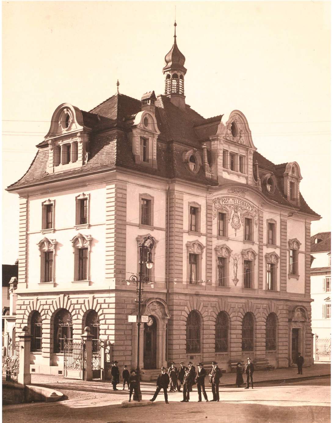
Postgebäude Schwyz, 1910, Postpalast mit beeindruckender Fassadenmalerei. [PGB000433]

Kunstkommission ist für die Organisation einer periodischen nationalen Ausstellung, für Kunstankäufe zum Schmuck staatlicher Gebäude und öffentlicher Sammlungen, für die Unterstützung von Initiativen für nationale Denkmäler sowie ab 1898 für die Vergabe von Stipendien zuständig. 4