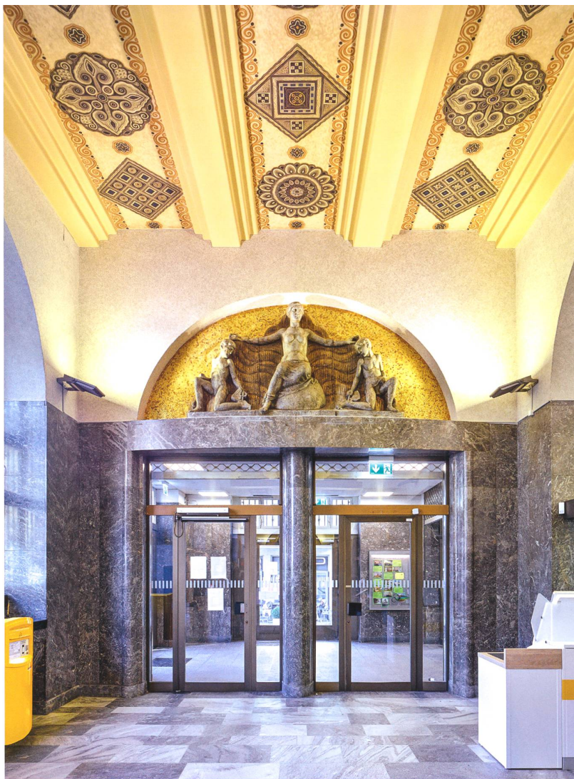
Die Schalterhalle der Hauptpost St. Gallen, hier Blick zur östlichen Eingangspartie, beeindruckt durch ihre reiche Raumgestaltung im Stil des in der Schweiz eben angekommenen Werkbundes (1913/15).

Ankauf, also die Förderung gehörte. Über die Jahre hat die Sammlung so eine bestimmte Grösse erreicht. Das Bewusstsein wuchs, dass sie einen zu grossen Wert und ein zu grosses Potenzial besass, als dass man sie hätte brachliegen lassen können. Der Wunsch nach Öffnung war einer der Gründe, weshalb 2019 meine Stelle als Sammlungskuratorin neu geschaffen wurde. In meinem ersten Jahr war ich hauptsächlich mit der Entwicklung einer neuen Sammlungsstrategie beschäftigt – einer Strategie, welche die Sammlung ganz bewusst der Öffentlichkeit zugänglich machen will.