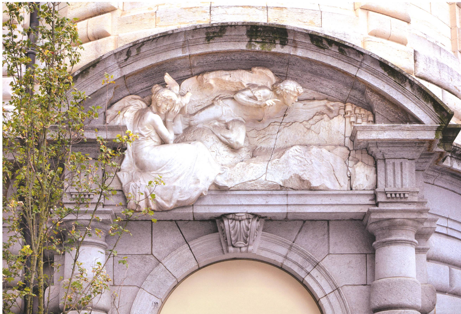
figura maschile in cui la plasticità della tensione muscolare degli arti si dissolve progressivamente nello spazio fino a fondersi con lo sfondo paesaggistico, reso con la tecnica dello stacciato (bassorilievo nel quale le sporgenze sono minime).

La stampa dell'epoca commentò l'opera chiattoniana in toni elogiativi. Il «Corriere del Ticino» del 25 gennaio 1911 non mancò di riallacciarsi alla polemica di cui si è detto sopra descrivendo il rilievo che «sembra annunciare ai passanti di quanta genialità sia capace l'anima di un artista ticinese anche se era di fronte a prescrizioni di soggetto e di spazio che gli imponevano dei limiti ben determinati e sempre a pregiudizio dell'ispirazione originale. Questo indicherà in modo chiaro a chi sta in alto quale manifestazione artistica imponente avremmo di certo avuto se ad architetti ticinesi fosse stata affidata anche la costruzione dell'intero palazzo».