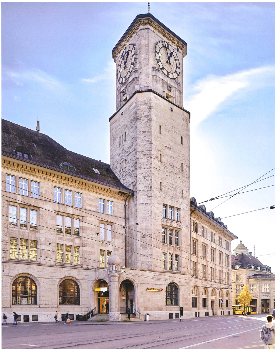
Das monumentale heutige Hauptpostgebäude in St. Gallen, erstellt 1911–1915 von den Zürcher Architekten Pflughard & Haefeli. Das Bauvolumen mit Turm widerspiegelt die internationale Bedeutung der damaligen St. Galler Stickerei.

städtischen Räumen stark an. Dabei wurden in der Konstruktion immer neue technische Raffinessen eingebaut, um die Abläufe zu sichern. 6